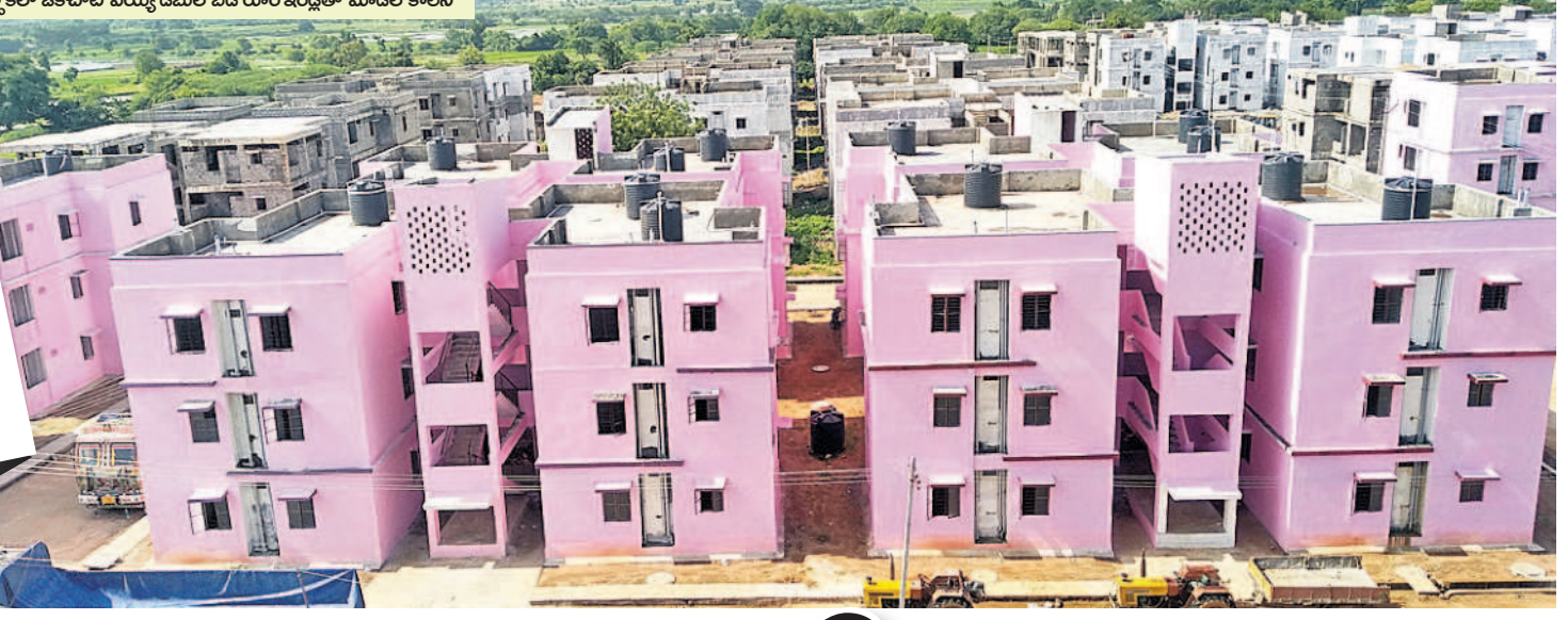
దుబ్బాకలో ఒకేచోట మొత్తం డబుల్ బెడ్ రూం ఇండ్లతో మోడల్ కాలనీ