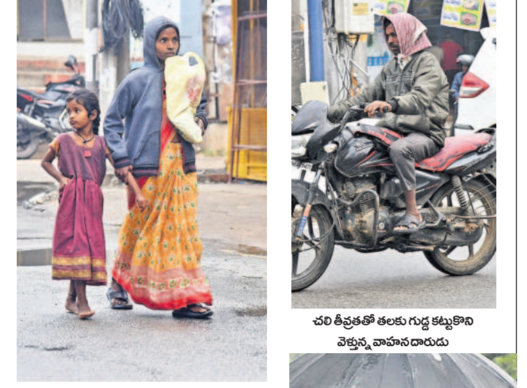
సిద్దిపేటలో చలి తీవ్రతతో స్వల్పంగా ముక్కి క్యాపులు ధరించిన ప్రజలు

వాతావరణ శాఖ హెచ్చరికలు జారీ చేసింది. ఈ మేరకు సిద్దిపేట జిల్లాకు హైదరాబాద్ వాతావరణ కేంద్రం ఎల్సీ ఆర్ఎల్ జారీ చేసింది. ఈడురుగాలులతో కూడిన వాన వర్షం, డిసెంబర్ 5: మంగళవారం ఉదయం నుంచి ఈడురు గాలులతో కూడిన వర్షం పడింది. దీంతో వ్యవసాయ పనులకు తీవ్ర ఆటంకం కలిగింది. చేతికొచ్చిన వరి ధాన్యాన్ని రోడ్లపైనే ఆరబెట్టారు. ముసురుకు చల్లటి ఈడురుగాలులు తోడయ్యాయి. అత్యవసర ప్రయోజనాలు తప్పే ఎక్కువ శాతం ప్రజలు ఇండ్లకే పరిమితమయ్యారు. మండలంలోని చాలా గ్రామాల్లో రోడ్లపైనే ఆరబెట్టిన ధాన్యంపై కవచం (పాలిథిన్) కప్పి ఉంచారు.