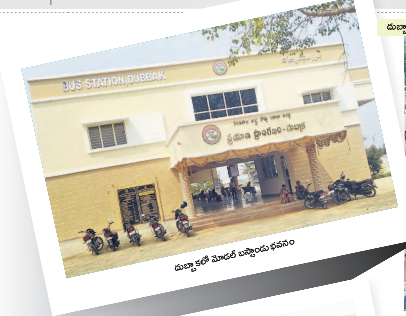
దుబ్బాకలో మోడల్ బస్స్టాండు భవనం