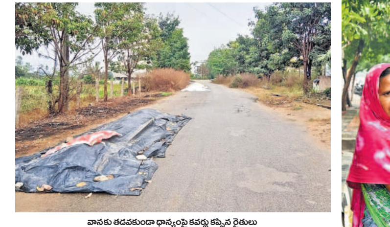
వానకు తడవకుండా ధాన్యంపై కవచం కప్పిన రైతులు