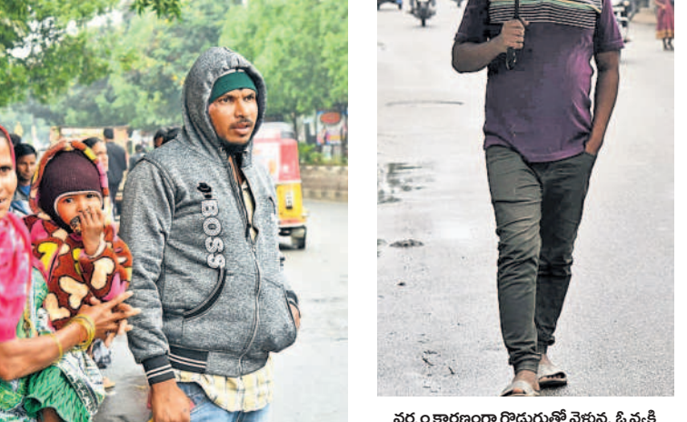
వర్షం కారణంగా గొడుగుల్లో వెళ్తున్న ఓ వ్యక్తి