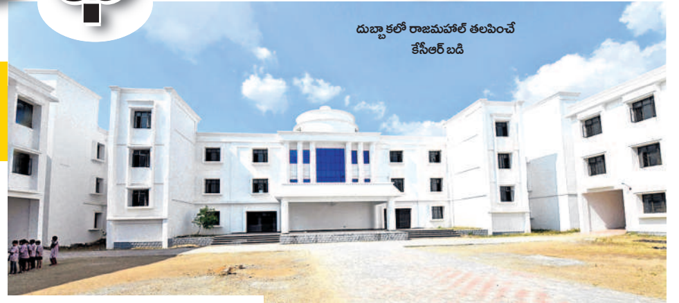
దుబ్బాకలో రాజమహల్ తలపించే కేసీఆర్ బడి