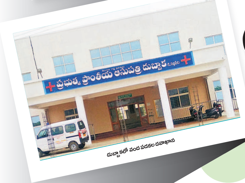
దుబ్బాకలో వంద పడకల దవాఖానం