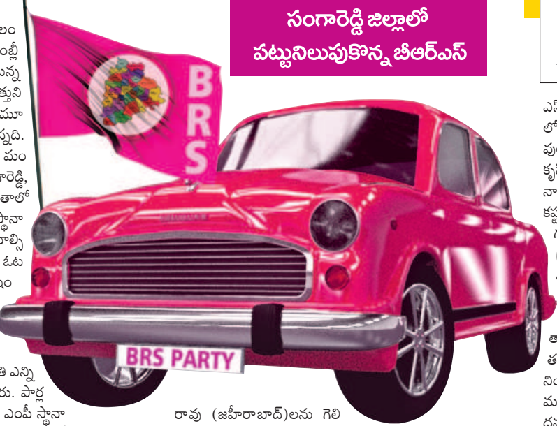
సంగారెడ్డి జిల్లాలో పట్టునిలుపుకొన్న బీఆర్ఎస్

సంగారెడ్డి డిసెంబర్ 5(నమస్తే తెలంగాణ) : సంగారెడ్డి జిల్లాలోని ఐదు అసెంబ్లీ స్థానాలను కైవసం చేసుకుంటూ మున్సిపల్ కాంగ్రెస్ కలలను బీఆర్ఎస్ పార్టీ తుక్కుని యలు చేసింది. మొత్తం ఐదు సీట్లలో మూడింటిని సాధించి పట్టు నిలుపుకొన్నది. మాజీ సీఎం కేసీఆర్ సారథ్యం, మాజీ మంత్రి హరీరావు పక్కా పూర్వహితో సంగారెడ్డి, పటాన్చెరు, జహీరాబాద్ గులాబీ ఖాతాలో చేరాయి. నారాయణపేట, అందోలు స్థానాలను ఒక శాతం ఓటు తేడాతో కోల్పోవాల్సి వచ్చింది. ఈ రెండు నియోజకవర్గాల్లో ఓటు మికి గల కారణాలను బీఆర్ఎస్ విశ్లేషించుకుంటున్నది.