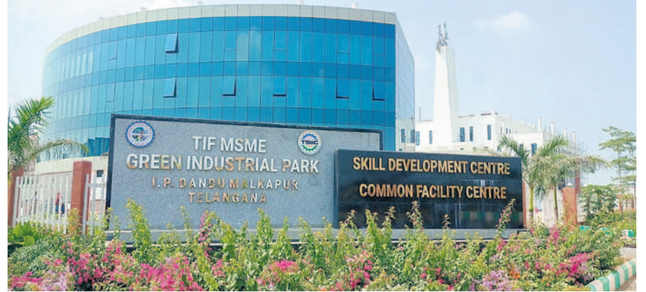
దండు మల్కాపురం ఇండస్ట్రియల్ పార్కులో ఎంఎస్ఎంసీ సింగిల్ విండ్ పార్కు భవన సముదాయం

నాట్లు వేసేటప్పుడు ఇవి పాటించాలి పొలంలో నాలుగొకటి 4-8 అడుగు కలిగిన వరి నారు ఇసుకూలు. బురద పడుతు ఉండేలా పొలాన్ని తయారు చేసుకొని 2-3 సింట్ల మీటర్ల లోతులో నాటితే మంచిది. ఎక్కువ లోతులో నాటితే పంటలు అలసట అవుతుంది. పంట కల సఖ్యులకు అనుకూలంగా ఉండేలా పొలాన్ని తయారు చేయాలి. నాటితే పంటలు నారు తలలు కుంచితే మంచిది. సరైన వయసులో మొక్కలు నాటితే కొనసాగు కత్తిరించాలి. అవసరం ఉండదు. సాధారణంగా తరగపు మీటరుకు దీర్ఘకాలిక రకాలైతే 33 కుదుర్చు, మధ్యకాలిక రకాలైతే 44, స్వల్పకాలిక రకాలైతే 50 కంటే ఎక్కువ కుదుర్చు ఉండేలా చూసుకోవాలి. సాధ్యమైనంత వరకు లేత నారును నాలుగోవడం మంచిది.