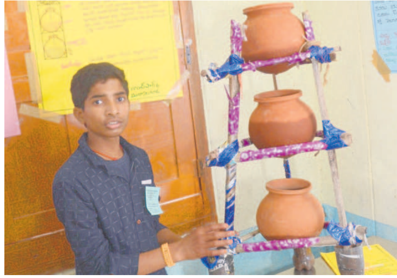
సైన్స్ ఫెయిర్లో విద్యార్థి ఎగ్జిబిట్ ప్రదర్శన (ఫైర్)

జిల్లా స్థాయి 'రాష్ట్రీయ బాలల వైజ్ఞానిక ప్రదర్శన' (ఆర్ఎస్బీపీ) పేరుతో జనవారీ లాల్ నెహ్రూ జాతీయ వైజ్ఞానిక గణిత - పర్యావరణ ప్రదర్శనను నిర్వహించేందుకు జిల్లా విద్యాశాఖ సిద్ధమైంది. ఇందులో భాగంగా 'సమాంతరం' పాటు 2022-23 విద్యా సంవత్సరంలో ఇన్స్పైర్ మానక్ అవార్డు, జిల్లా వ్యాప్తంగా వివిధ పాఠశాలల నుంచి ఎంపికైన 101 ప్రాజెక్టుల ప్రదర్శన కూడా ఉంటుంది. దీంతో కత్తమమైన్ సైన్స్ వారాన రణం జిల్లాలో నిర్వహించే సైన్స్ ఫెయిర్ లో దర్శనమివ్వనున్నదని చెప్పాడు.