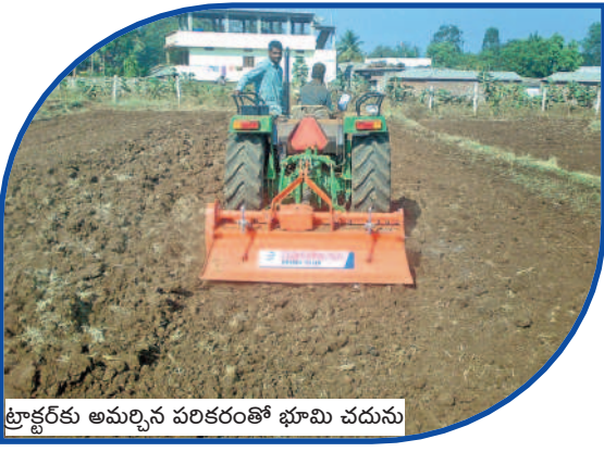
ట్రాక్టర్ కు అమర్చిన పరికరంతో భూమి చదును

సమయానికి దైవానుగ్రహం ప్రసందిస్తుందనే భావన కలిగిస్తున్నారు. వివాహ సమయంలో వధూవరుల చేతుల్లో పెళ్లి కొబ్బరిబొండాలు ముఖ్యం, పగడాలు, కెంపులతో కొత్త ఆకర్షణలు తీసుకువస్తున్నారు. వేడుకల్లో ఇప్పుడు సంప్రదాయ కర్పూర దండలు కొత్త రూపాల్లో కనువిందు చేస్తున్నాయి. తలంబ్రాలకు వాడే కొబ్బరి కుర్రడిలను సైతం నిర్వాహకులు అద్భుతంగా ముస్తాబు చేస్తున్నారు. ఇక పెళ్లి మండపం ముస్తాబైతే చెప్పినక్కర్లేదు. ఈవెంట్ మేనేజర్లు మండపం కోసం పూలను హైదరాబాద్, బెంగళూరు నగరాల నుంచి పెద్ద ఎత్తున తెప్పిస్తున్నారు. కళ్లు మిరిమిట్ట గొలిపే రైటింగ్ సమకూరుస్తున్నారు.