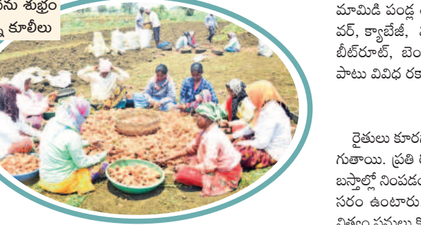
క్యారెట్ ను శుభ్రం చేస్తున్న కూలీలు

వికారాబాద్, డిసెంబర్ 5 : గతంలో వర్షాలపై ఆధారపడి పంటలు సాగు చేసేవారు కొంత మంది రైతులు. ఆరు గాలం కష్టపడి పండించే పంటల తక్కువ ఆదాయం వచ్చేది. గ్రామస్థాయిలో వ్యవసాయాధికారులు, ఉద్యానశాఖ అధికారుల సలహాలు, సూచనలు పాటిస్తూ కారగాయలు సాగు చేసే రైతులు లాభాలు తప్పా, నష్టాలు అనే మాటే మరిచారు. వికారాబాద్ మండలం నారాయణపూర్లో 70 నుంచి 80 శాతం వరకు రైతులు సుమారు 500 ఎకరాల వరకు రైతులు కారగాయల సాగు చేస్తున్నారు. ఈ సాగుతో తక్కువ పెట్టుబడి, తక్కువ సమయంలో ఎక్కువ లాభాలు గడించే అవకాశాలు వున్నాయి. సంవత్సరానికి మూడు పంటలు తీరువచ్చు. బోరు, బావుల సహాయంతో నీటిని వినియోగించుకోవచ్చు. డ్రీప్ సహాయంతో రైతులు అన్ని రకాల కారగాయలు, ఆకుకూరల పంటలు సాగు చేస్తున్నారు. పండించిన పంటలను వాహనాల ద్వారా ప్రతి రోజూ హైదరాబాద్ కు తరలిస్తుంటారు. ప్రతి రోజూ ఆదాయం, చేతి నిండా పని ఉండడంతో రైతులు ఆనందంగా ఉన్నారు. ఒక్కో రైతుకు నెలకు దాదాపు రూ.50 నుంచి 60 వేల వరకు ఆదాయం వస్తున్నది.