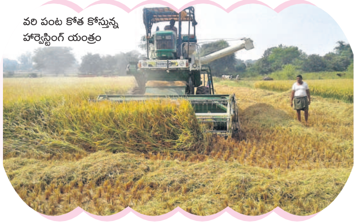
వరి పంట కోత కోస్తున్న హార్వెస్టింగ్ యంత్రం

గతంలో సబ్సిడీపై రైతులకు పరికరాలు గత టీఆర్ఎస్ ప్రభుత్వం రైతుల పట్ల ప్రత్యేక శ్రద్ధ తీసుకొని ట్రాక్టర్, పలు