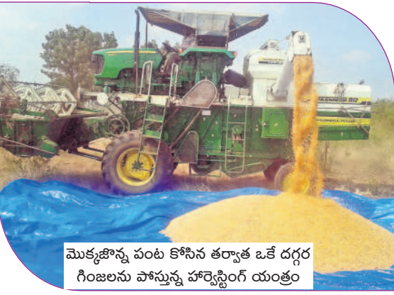
మొక్కజొన్న పంట కోసిన తర్వాత ఒకే దగ్గర గింజలను పోస్తున్న హార్వెస్టింగ్ యంత్రం