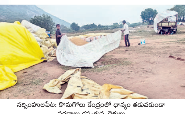
నర్సంపాలపేట: కొనుగోలు కేంద్రంలో ధాన్యం తడువకుండా పరదాలు కప్పిస్తున్న రైతులు