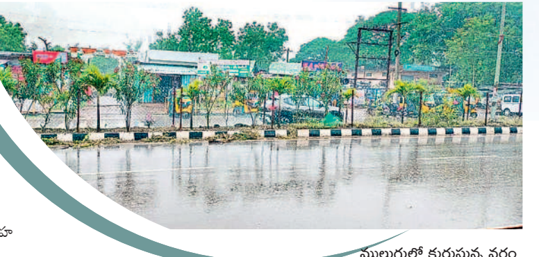
ములుగులో కురుస్తున్న వర్షం