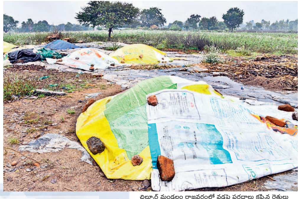
బిల్వూరు మండలం రాజవరంలో వడ్లపై పరదాలు కప్పిన రైతులు