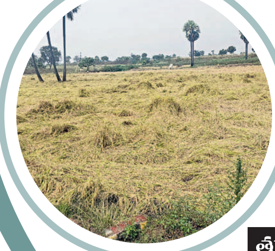
అత్తకూరు : హోమబుజార్లలో నేలవాలిన వరి