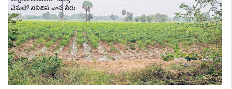
కాటారం : శంకరంపల్లిలో..