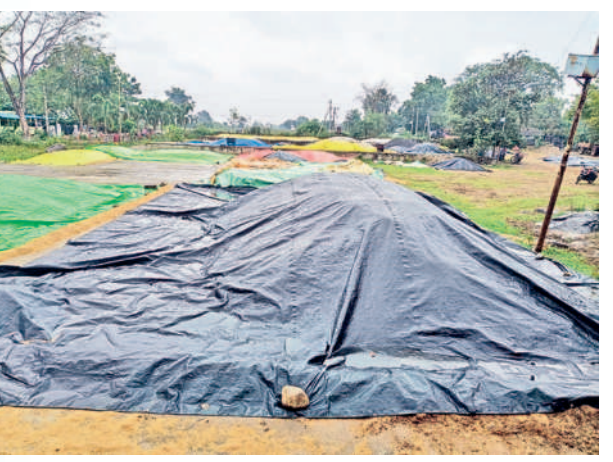
ఖానాపూరు : ఆరబోసుకున్న ధాన్యంపై పరదాలు కప్పిన రైతులు