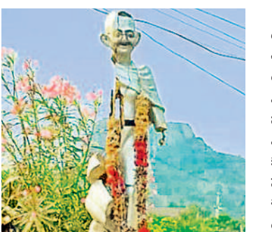
ధ్వంసమైన గాంధీజీ విగ్రహం

హనుమకొండ, డిసెంబర్ 5: గాంధీజీ విగ్రహం ధ్వంసం చేసిన వారిపై కేసు నమోదైంది.