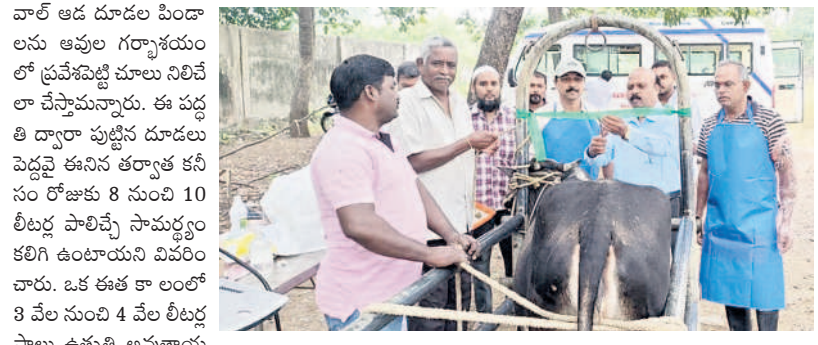
పశు వైద్య శిబిరాన్ని ప్రారంభిస్తున్న జిల్లా పశువైద్యాధికారి