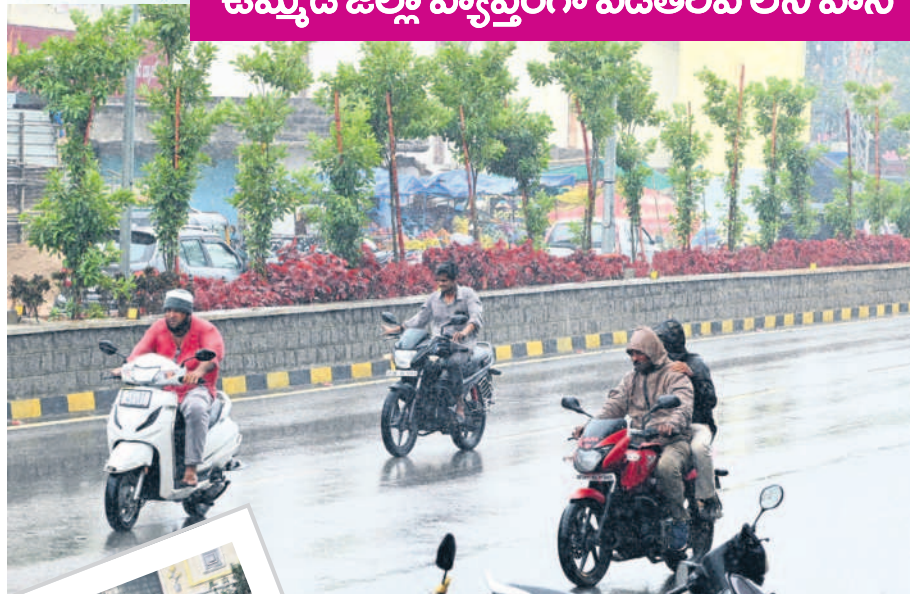
నల్లగొండ జిల్లా కేంద్రంలో కురుస్తున్న చిరుజల్లులు

ఉమ్మడి జిల్లా వ్యాప్తంగా ఎడతెరిపి లేని వాన