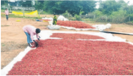
కూసుమంచి : మిగిల్చిన ఆరబెడుతున్న రైతులు

కూసుమంచి, డిసెంబర్ 6: మిగ్జాం తుపాన్ రైతులను కన్నీళ్లు మిగిల్చింది. తుపాన్ తాకిడికి వరి, మిర్చి, మినుము పంటలు వేసిన రైతులు నష్టపోయారు. రెండు రోజులుగా కురుస్తున్న వర్షాలకు చేతికొచ్చిన పంటలు నీళ్ల పాలయ్యాయి. కళాల్లో ఆరబెట్టిన ధాన్యం తడవడంతో ఆరబెట్టే పనిలో రైతులు నిమగ్నమయ్యారు. కూసుమంచి మండలం మల్లేపల్లిలో రైతుల పంటలు తడవడంతో తీవ్రంగా నష్టపోయారు. నష్టపోయిన పంటలకు పరిహారం ఇవ్వాలని రైతులు ప్రభుత్వాన్ని కోరారు.