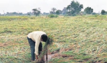
ఖమ్మం రూరల్ : నీట మునిగిన వరిపంట