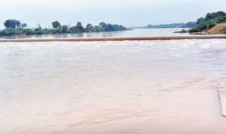
ఉధృతంగా ప్రవహిస్తున్న మధిర మున్నేరు