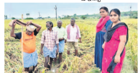
బోనకల్లు : వరిపైరును పరిశీలిస్తున్న ఏవో, ఏకావోలు

కూసుమంచి, డిసెంబర్ 6: తుపాన్ తో తోటలు దెబ్బ తినకుండా తగిన జాగ్రత్తలు తీసుకోవాలని ఉద్యానవన అధికారి అప్పర్ రైతులను కోరారు. మండలంలోని చేగొమ్మ, ముత్యాల గూడిం, చింతలతండా కేస్యాపురం ప్రాంతాల్లోని మిర్చి తోటలను బుధవారం ఆమె పరిశీలించి సూచనలు చేశారు.