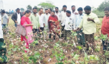
ముదిగొండ : పత్తి పంటను పరిశీలిస్తున్న అధికారులు