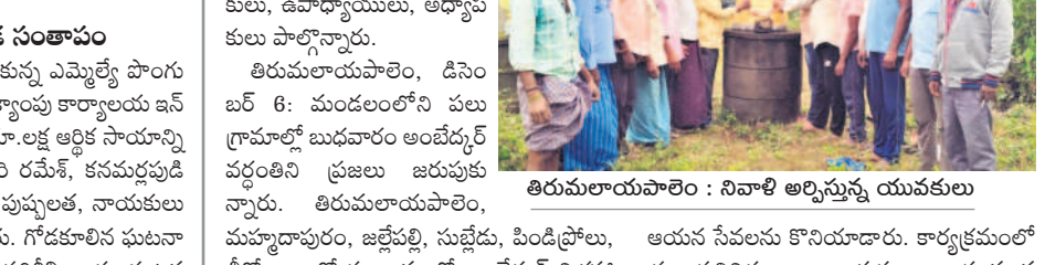
తిరుమలాయపాలెం : నివాళి అర్పిస్తున్న యువకులు

తిరుమలాయపాలెం, డిసెంబర్ 6: మండలంలోని పలు గ్రామాల్లో బుధవారం అంబేద్కర్ వర్ధంతిని ప్రజలు జరుపుకున్నారు. తిరుమలాయపాలెం, మహ్మదాపురం, జల్లేపల్లి, సుజ్జేడు, పిండిప్రోలు, ఆయన సేవలను కొనియాడారు. కార్యక్రమంలో బీరోలు, బచ్చోడు గ్రామాల్లో అంబేద్కర్ విగ్రహ ప్రజాప్రతినిధులు, నాయకులు, యువజన నికీ పూలమాలలు వేసి శ్రద్ధాంజలి ఘటించారు. సంఘాల నేతలు పాల్గొన్నారు.