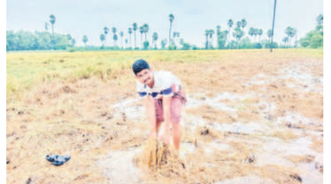
చింతకాని : సీతంపేటలో నీటమునిగిన వరిపైరు