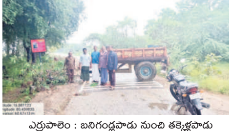
ఎర్రపాలెం : బనిగండ్లపాడు నుంచి తక్కువపాడు రాకపోకలు నిలిపివేసిన అధికారులు