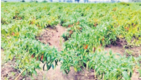
బోనకల్లులో గాలివానకు నేలకొరిగిన మిర్చిపైరు

కూసుమంచి, డిసెంబర్ 6: తుపాన్ తో తోటలు దెబ్బ తినకుండా తగిన జాగ్రత్తలు తీసుకోవాలని ఉద్యానవన అధికారి అప్పర్ రైతులను కోరారు. మండలంలోని చేగొమ్మ, ముత్యాల గూడిం, చింతలతండా కేస్యాపురం ప్రాంతాల్లోని మిర్చి తోటలను బుధవారం ఆమె పరిశీలించి సూచనలు చేశారు.