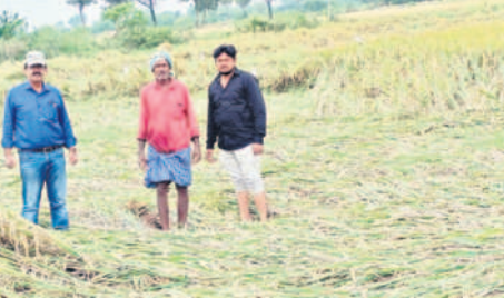
తిరుమలాయపాలెం : పాలాలను పరిశీలిస్తున్న ఏవో