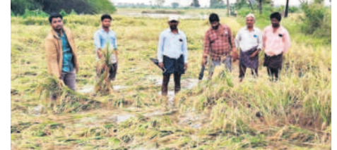
మధిర రూరల్ : పంటను పరిశీలిస్తున్న క్షేత్ర అధికారులు