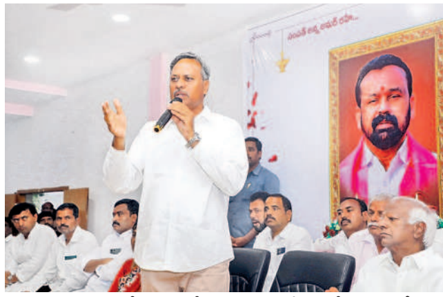
మాట్లాడుతున్న ఎమ్మెల్యే పల్లె రాజేశ్వర్ రెడ్డి, చిత్తంలో ఎమ్మెల్యే కడియం శ్రీహరి