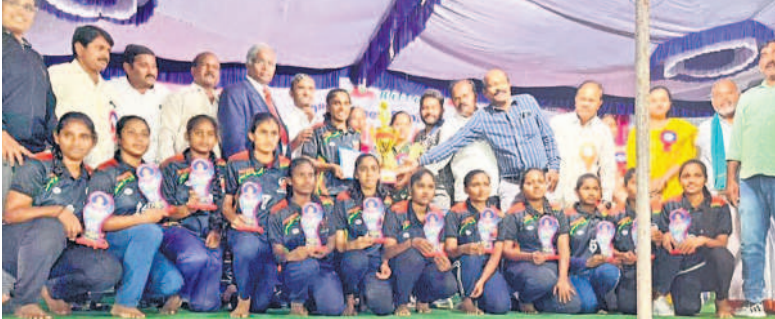
రాష్ట్ర స్థాయిలో మూడో స్థానం సాధించిన జనగామ జిల్లా సీనియర్ మహిళా కబడ్డీ జట్టు