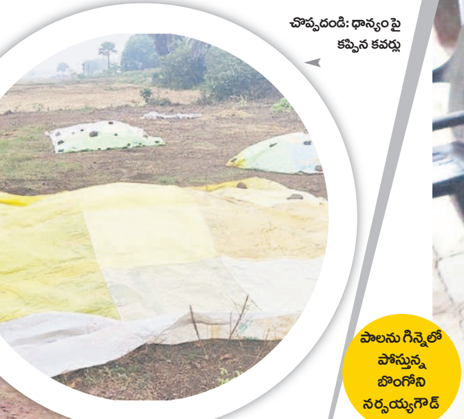
చొప్పడం: ధాన్యం పై కప్పిన కవర్లు

వానకాలం ధాన్యం సేకరణ దాదాపుగా ముగింపు దశకు వచ్చింది. ప్రస్తుతం యాసంగి ప్రాంతభూమిపై ఉన్నది. నీటి సౌకర్యాన్ని బట్టి ఎప్పటిలాగే కొంత మంది రైతులు కాస్త ముందుగానే యాసంగి నారు పోసుకున్నారు. పదిహేను రోజుల క్రితమే పోసిన నారు మరో 15, 20 రోజుల్లో పచ్చి పంట పోసుకునే దశకు చేరుకుంటుంది. ఈ దశలో మిగ్జాం తుఫాన్ ప్రభావంతో చలి పెరుగడం, మబ్బు పట్టి ఉంటుండడంతో అవసరమైనంత ఎండ నారుకు తగలడం లేదు. దీంతో ముందుగా పోసుకున్న నారు ఎరువు రంగుకు మారే ముప్పున్నదని ఆందోళన రైతుల్లో వ్యక్తమవుతున్నది. రంగు మారితే నత్రజని వాడాలైన పరిస్థితి వస్తుంది. కాస్త రంగు ఎక్కువ మారితే అది పని చేయదంటున్నారు. మరో వైపు ఈ సమయానికి నారు పోసుకునే రైతులు ప్రస్తుత చల్లని వాతావరణం తగ్గితే నారు పోయడానికి మొలకలు నానబెట్టుకోవడానికి ఎదురు చూస్తున్నారు. ఈ వాతావరణంలో పోటీ మొలకలైన నారు చల్లడనానికి, చిరు జల్లులకు మురిగి పోతుందని చెబుతున్నారు. మిగ్జాం ప్రభావం ఎప్పుడు తగ్గడం..? అని ఎదురుచూస్తున్నారు.