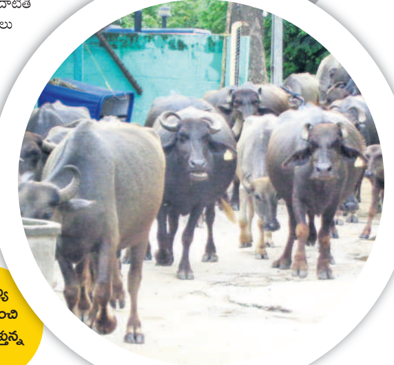
నర్సయ్య ఇంటి నుంచి మేతకు వెళ్తున్న గేదెలు

లను నిర్వహించేందుకు సిద్ధంగా ఉండాలని రాష్ట్ర ఎన్నికల సంఘం కలెక్టర్లకు ఉత్తర్వులు జారీ చేసింది. అందుకోసం రిటర్నింగ్ అధికారులు, పోలింగ్ సిబ్బందిని నియమించడంతోపాటు పంచాయతీ ఎన్నికల కోసం సదరు సిబ్బందికి కిక్ ఇవ్వాలని సూచించింది. దీంతో పాటు పోలింగ్ కేంద్రాల పరిధిలో సిబ్బందిని నియమించడం కోసం సుష్టమైన ఆదేశాలు జారీచేసింది. 200 ఓటర్లు ఉన్న పోలింగ్ స్టేషన్ల పరిధిలో ఒక ప్రైవేట్ డింగి అధికారి ఒక పోలింగ్ అధికారిని నియమించాలని సూచించింది. అలాగే 201 నుంచి 400 మంది ఓటర్లు ఉన్న కేంద్రంలో ఒక ప్రైవేట్ డింగి అధికారి ఒక పోలింగ్ అధికారులను నియమించాలని సూచించింది. అలాగే 401 నుంచి 650 వరకు ఓటర్లు ఉంటే ఒక ప్రైవేట్ డింగి అధికారి, ముగ్గురు పోలింగ్ అధికారులను నియమించుకోవాలని ఆదేశించింది. ప్రతి వార్డులో ఒక పోలింగ్ బూత్ ఉండేలా చర్యలు తీసుకోవాలని, 650 దాటితే రెండు పోలింగ్ కేంద్రాలు ఏర్పాటు చేయాలని ఎన్నికల సంఘం ఆదేశించింది. సిబ్బంది తోపాటు ప్రైవేట్ డింగి అధికారులతో జూరితా సిద్ధం చేసుకోవాలని ఆదేశాల్లో స్పష్టం చేసింది.