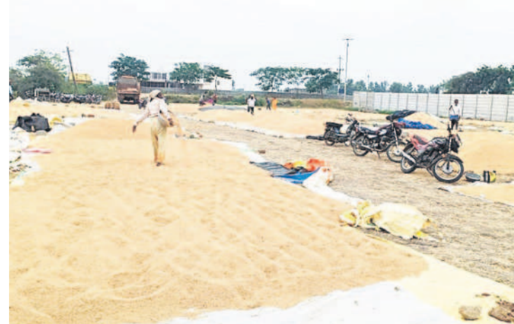
పెద్దపల్లి: వాన గెరువు ఇవ్వడంతో నిమ్మపల్లి తోటనుగోలు కేంద్రంలో వచ్చి ఆరబోస్తున్న మహిళా రైతులు

కొనుగోలు కేంద్రాల్లో ధాన్యం మిగ్జాం తుఫాన్ రైతులను ఆందోళనకు గురి చేస్తున్నది. ఇప్పటికీ కొనుగోలు కేంద్రాల్లో ధాన్యం నిల్వలు పెద్ద మొత్తంలోనే ఉండగా, యంత్రాంగం అప్రమత్తమైంది. రెండ్రోజులు నుంచి పరిస్థితిని