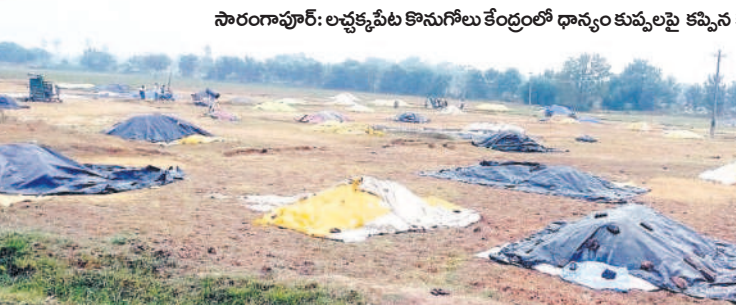
సారంగాపూర్: అక్కడక్కడా కొనుగోలు కేంద్రాల్లో ధాన్యం కప్పకుంటూ పని చేస్తున్నారు.

పనులనుగోలుగ చేస్తున్నది. అన్ని జిల్లాలకలి నమోదైంది. హుజూరాబాద్లో 22.6 మిల్లీమీటర్ల వర్షం పడింది. ఈ డివిజన్లోని మిగ్జాం మండలాల్లోని ఇల్లడంకంటలో 9.2, ఇమ్మిగంటలో 7.2, పింజంకంటలో 7.8, సైదాపూర్లో 9.8, మీజంకంటలో 5.0, మిల్లి మీటర్ల వర్షం కురిసింది. ఇక కరీంనగర్లో డివిజన్లోని చిగురుమామిడిలో 9.6, గంగాధరలో 2.6, రామచంద్రంలో 3.2, చొప్పడంలో 4.0, కొత్తపల్లిలో 2.2, గన్నవరంలో 5.2, కరీంనగర్లో 1.6, మానకొండూర్లో 2.4, తిమ్మాపూర్లో 3.8 మిల్లీమీటర్ల వర్షం పడింది.