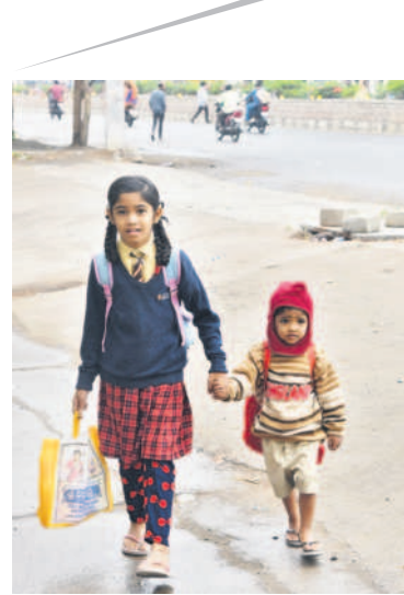
కరీంనగర్, డిసెంబర్ 6 (నమస్తే తెలంగాణ) / చొప్పడం: మిగ్జాం తుఫాన్ ప్రభావంతో జిల్లా గణజంతు పరిశోధనా కేంద్రంలో అక్కడక్కడా మోస్తరు వర్షం పడుతున్నది. మూడు రోజులుగా ఆకాశం మేఘాచ్ఛత్రమై ఉన్నందున ఎండ కనిపించడం లేదు. ధరణిపాఠం పంటి ఉష్ణోగ్రతలు 23 కు, రాత్రి ఉష్ణోగ్రతలు 20కి పడిపోయాయి. చలి వినయంగా పెరిగింది. ఈదురు గాలులు వీసినందున ప్రజలు ఇండ్ల నుంచి బయటికి రాకుండా ఉన్న దుస్తులు ధరించి జాగ్రత్తలు తీసుకుంటున్నారు. చిన్న పిల్లలు, వృద్ధులు తీవ్ర ఇబ్బందులు పడుతున్నారు.

ఏండ్లుగా ఇక్కడ ఓటర్లు వినుతున్నారా తీర్పునిస్తున్నారు. ప్రతి ఎన్నికలోనూ కొత్త వారికి అవకాశం ఇస్తూ సరి కొత్త సంప్రదాయం కొనసాగిస్తున్నారు.