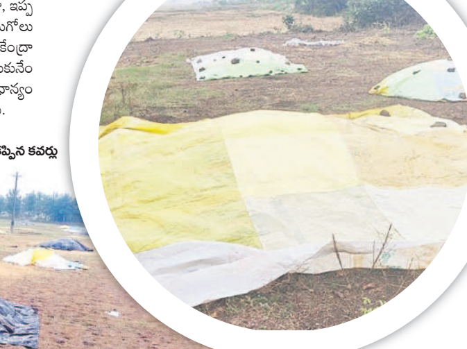
సారంగాపూర్: అక్కడక్కడా తోటనుగోలు కేంద్రాల్లో ధాన్యం కుప్పలపై కప్పిన కవచం

రంగుమారుతున్న వరి నారు వానకాలం ధాన్యం సేకరణ దాదాపుగా ముగింపు దశకు వచ్చింది. ప్రస్తుతం యాసంగి ప్రాంతభవనం వద్దనున్నది. నీటి సౌకర్యాన్ని బట్టి ఎప్పుటిలాగే కొంత మంది రైతులు కాస్త ముందుగానే యాసంగి నారు పోసుకున్నారు. పదిహేను రోజుల క్రితమే పోసిన నారు మరో 15, 20 రోజుల్లో పచ్చి మేనుకునే దశకు చేరుకుంటుంది. ఈ దశలో మిగిలిన తుఫాన్ ప్రభావంతో చలి పెరుగడం, మబ్బు పట్టి ఉంటుండడంతో అవసరమైనంత ఎండ నారుకు తగలడం లేదు. దీంతో ముందుగా పోసుకున్న నారు ఎరువు రంగుకు మారే ముప్పున్నదని ఆందోళన రైతుల్లో వ్యక్తమవుతున్నది. రంగు మారితే నత్రజని వాడాలైన పరిస్థితి వస్తుంది. కాస్త రంగు ఎక్కువ మారితే అది పని చేయదంటున్నారు. మరో వైపు ఈ సమయానికి నారు పోసుకునే రైతులు ప్రస్తుత చల్లని వాతావరణం తగ్గితే నారు పోయడానికి మొలకలు నానబెట్టుకోవడానికి ఎదురు చూస్తున్నారు. ఈ వాతావరణంలో పోస్తే మొలకలైన నారు చల్లడనానికి, చిరు జల్లులకు మురిగి పోతుందని చెబుతున్నారు. మిగిలిన ప్రభావం ఎప్పుడు తగ్గకుండా..? అని ఎదురుచూస్తున్నారు.