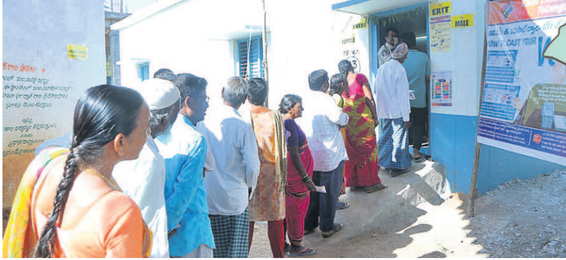
చొప్పదండిలో ఓటు వేసేందుకు క్యూలో నిలబడ్డ ఓటర్లు (డైరీ)