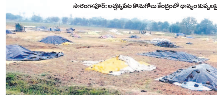
సారంగాపూర్: అక్కడక్కడా తోటనుగోలు కేంద్రాల్లో ధాన్యం కుప్పలపై కప్పిన కవచం

ఎప్పుటికప్పుడు సమీక్షిస్తున్నది. అన్ని జిల్లాల కలిపి సమాధింది. హుజూరాబాద్లో 2.2, మిల్కీమీటర్ల వర్షం పడింది. ఈ డివిజన్లోని మిగిలిన మండలాల్లోని ఇల్లడకుంటలో 9.2, ఇమ్మిగులలో 7.2, పింజనం లో 7.8, సైదాపూర్లో 9.8, మీజనం కలో 5.0, మిల్కీమీటర్ల వర్షం కురిసింది. ఇక కరీంనగర్లో డివిజన్లోని చిగురుమామిడిలో 9.6, గంగాధరలో 2.6, రామడుగులో 3.2, చొప్పదండిలో 4.0, కొత్తపల్లిలో 2.2, గన్నేరువరలో 5.2, కరీంనగర్లో 1.6, మానకొండూర్లో 2.4, తిమ్మాపూర్లో 3.8 మిల్కీమీటర్ల వర్ష పాతం నమోదైంది.