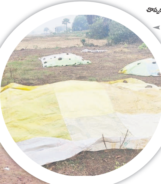
చొప్పదండి: ధాన్యం పై కప్పిన కవచం

రంగుమారుతున్న వరి నారు వానకాలం ధాన్యం సేకరణ దాదాపుగా ముగింపు దశకు వచ్చింది. ప్రస్తుతం యాసంగి ప్రాంతభవనం వద్దనున్నది. నీటి సౌకర్యాన్ని బట్టి ఎప్పుటిలాగే కొంత మంది రైతులు కాస్త ముందుగానే యాసంగి నారు పోసుకున్నారు. పదిహేను రోజుల క్రితమే పోసిన నారు మరో 15, 20 రోజుల్లో పచ్చి మేనుకునే దశకు చేరుకుంటుంది. ఈ దశలో మిగిలిన తుఫాన్ ప్రభావంతో చలి పెరుగడం, మబ్బు పట్టి ఉంటుండడంతో అవసరమైనంత ఎండ నారుకు తగలడం లేదు. దీంతో ముందుగా పోసుకున్న నారు ఎరువు రంగుకు మారే ముప్పున్నదని ఆందోళన రైతుల్లో వ్యక్తమవుతున్నది. రంగు మారితే నత్రజని వాడాలైన పరిస్థితి వస్తుంది. కాస్త రంగు ఎక్కువ మారితే అది పని చేయదంటున్నారు. మరో వైపు ఈ సమయానికి నారు పోసుకునే రైతులు ప్రస్తుత చల్లని వాతావరణం తగ్గితే నారు పోయడానికి మొలకలు నానబెట్టుకోవడానికి ఎదురు చూస్తున్నారు. ఈ వాతావరణంలో పోస్తే మొలకలైన నారు చల్లడనానికి, చిరు జల్లులకు మురిగి పోతుందని చెబుతున్నారు. మిగిలిన ప్రభావం ఎప్పుడు తగ్గకుండా..? అని ఎదురుచూస్తున్నారు.