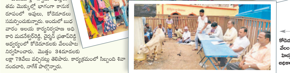
కోడెదూడల వేలం నిర్వహిస్తున్న అధికారులు