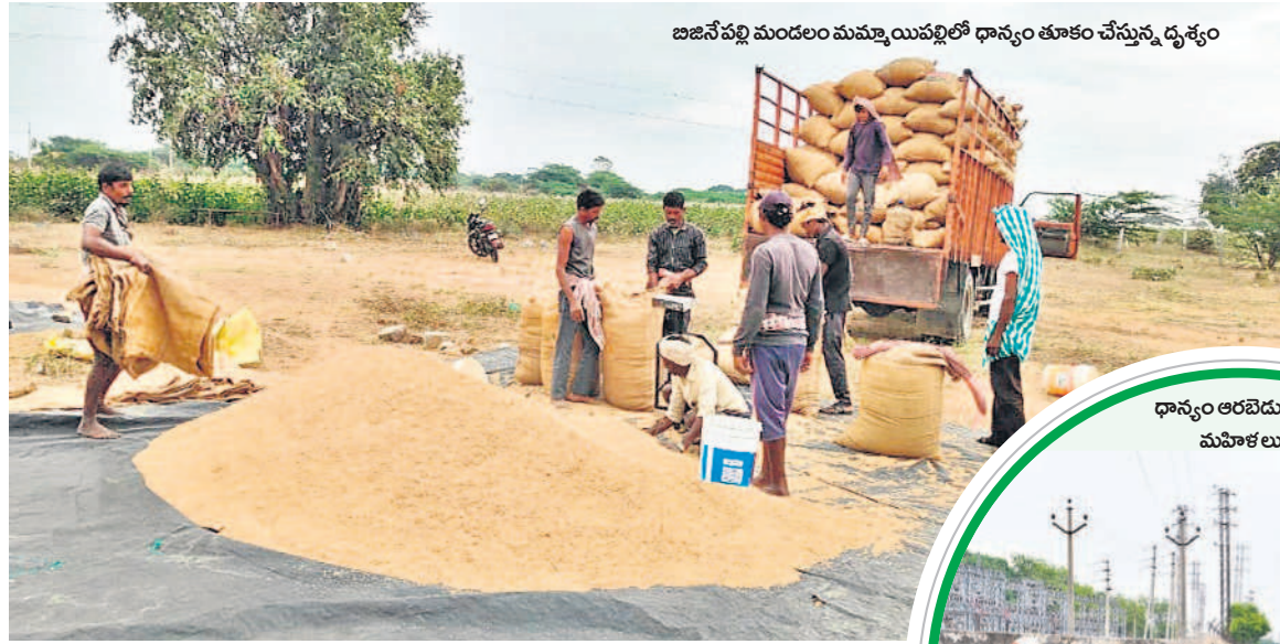
జిజనీపల్లి మండలం మమ్మాయిపల్లిలో ధాన్యం తూకం చేస్తున్న దృశ్యం

మహబూబ్ నగర్, డిసెంబర్ 6 (నమస్తే తెలంగాణ ప్రతినది) : ఉమ్మడి మహబూబ్ నగర్ జిల్లాలో ఈ ఏడాది రికార్డు స్టాయిలో వరి ధాన్యానికి ధర పలుకుతుండడంతో అన్నదాతల్లో ఆనందం వ్యక్తమవుతున్నది. ఈ ఏడాది వానకాలం సీజన్ నిరాశ జనకంగా ఉన్నప్పటికీ చెరువులు, కుంటలు, రిజర్వాయర్ల కింద పరిధాన్యం దిగుబడి అంచనాలకు మించి వచ్చింది. ఆయా జిల్లాల్లో రైతులు వివిధవిధాల వరిని పండిస్తున్నారు. గతంలోకంటే ఈసారి సాగు సీత అందుబాటులో ఉండటం, బోరుబావుల్లో స్వతం పూట వస్తుండడంతో రైతులు పెద్దఎత్తున సాగు చేశారు. అయితే వరికోతకు వచ్చే దశలో ప్రతిసారి బహిరంగ మార్కెట్లో రేటు పడిపోవడం జరుగుతుంది. ఈసారి బహిరంగ మార్కెట్లో ఎక్కువ ధర పలుకుతుండడంతో రైతులు ఆనందంలో ఉన్నారు. రైతులు మార్కెట్ కు వెళ్లకుండానే వ్యాపారస్తులు కల్లాల వద్దకు వచ్చి ధాన్యాన్ని కొనుగోలు చేస్తున్నారు. ప్రస్తుతం మార్కెట్లో మద్దతు ధర కన్నా రూ.1,800 వరకు ఎక్కువ ధర లభిస్తుంది. ఆయా