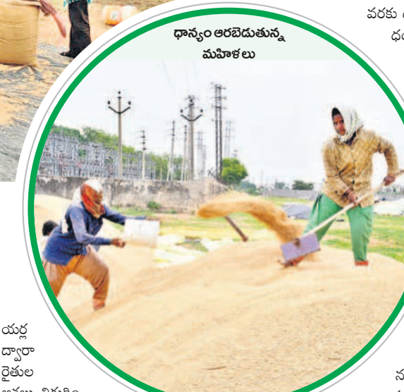
ధాన్యం ఆరబెడుతున్న మహిళలు

విగా పరిధాన్యాన్ని పండిస్తుండడంతో ధాన్యభాండారంగా మారింది. ప్రతి ఏటా జిల్లాలో వరి పండించే రైతుల సంఖ్య పెరుగుతూనే ఉంది. ప్రత్యామ్నాయ పంటలు చేయాలని, లాభదాయకమైన పంటల సాగు చేపట్టాలని వ్యవసాయ అధికారులు సూచిస్తున్నప్పటికీ రైతులు వరి వైపే మొగ్గు చూపుతున్నారు. ఈ ఏడాది వానకాలంలో వర్షాభావ పరిస్థితులు వెంటాడాయి. అలస్యంగా వర్షాలు పడ్డప్పటికీ రైతులు బోరుబావుల నుంచి పంటలకు సాగునీరు అందించి కాపాడారు. ఒక దశలో పంటలు ఎండిపోతాయని ఆందోళన చెందినప్పటికీ వరుణుడు కరుణించడంతోపాటు రిజర్వాయర్ల