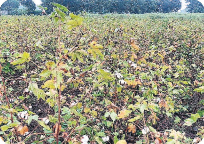
వర్షానికి తడిసిన పత్తి పంట

ఈదురుగాలులు, చిరుజల్లులతో వర్షగా పంట నష్టం ఏం లేదని అధికారులు చెప్పిస్తా.. చేతికొచ్చిన పత్తి, వరికి మాత్రం కోలుకోలేని దెబ్బ తగిలి అవశాశం ఉందని నిపుణులు హెచ్చరిస్తున్నారు.