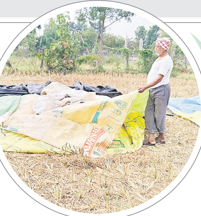
పెంచికల్పేట్ : ధాన్యంపై కవర్లు కప్పేతున్న రైతు

వాంకీడ్/కెరమెరి, డిసెంబర్ 6: మిజాంగ్ తుఫాన్ కారణంగా వర్షం, ఈదురు గాలులతో ఇబ్బందులు ఎదురవుతున్నాయి. రెండు రోజులుగా చిరు జల్లులు పడుతుండగా, వాతావరణం చల్లబడింది. మిర్చి, పత్తి పంట నేలరాలుతున్నది. పత్తి తడిసి పోయి రైతుకు నష్టం వాటిల్లుతున్నది. కెరమెరి మండలంలో కంది పంట సైతం ఎప్పుగా పెరిగి పూతపూసి కాయలు కాస్తాన్న నేపథ్యంలో ఈదురు గాలులతో నేల కలిగిగాయ. అకాల వర్షంతో అన్నదాతలు పరేషాన్ లో వడ్డారు.