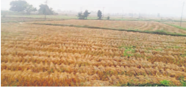
వర్షంలో తడుస్తున్న కోసి ఎండవెట్టిన వరిపంట

బెజ్జూర్, డిసెంబర్ 6: ఎడతెలిపి లేకుండా కురుస్తున్న వర్షంతో మండలంలో పత్తి, వరి పంటలు తడసి పోతున్నాయి. ప్రస్తుతం రైతులు వరి కోతలతో పాటు పత్తి తీస్తున్న నేపథ్యంలో పంటలు తడవడంతో రైతులు ఇబ్బంది పడుతున్నారు. ఈదురు గాలులు వీస్తుండడంతో చలి తీవ్రత పెరిగి కూలీలకు పనికి వెళ్లేలేని పరిస్థితి నెలకొంది.