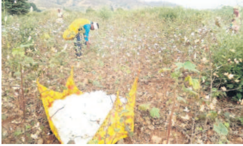
రైతులు ఎవరి చేసులో వారే కొద్దికొద్దిగా ఏరుకుంటున్న పత్తి

కూలీల ప్రయోజన భర్తించేందుకు సిద్ధంగా ఉన్నా. పత్తి ఏరేందుకు ముందుకు రావడం లేదు.. దీంతో కొంత మంది రైతులు వారి కుటుంబసభ్యులు కలిసి పత్తిని ఏరుతుంటున్నారు. జిల్లాలో సుమారు 97 వేల రైతు కుటుంబాలున్నాయి. రైతు కూలీలు సుమారు 99 వేల మంది ఉన్నారు. మహారాష్ట్ర సరిహద్దుల్లో ఉన్న మండలాల్లో పత్తిని ఏరేందుకు ప్రతి సంవత్సరం పొరుగు రాష్ట్రం నుంచి కూలీలు వస్తారు. యాపత్ మార్, నాండ్ జిల్లాల నుంచి కూలీల కుటుంబాలు ఇక్కడికి వచ్చి రెండు మూడు నెలల పాటు ఇక్కడే ఉంటాయి. ఈ ఏడాది అక్కడి నుంచి కూడా రాలేదు.