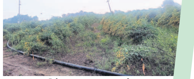
బండల్ నాగపూర్ లో ముసురు ఈడుగుగాలులకు వంగిన కంది పంట

పెంచికల్పేట్, డిసెంబర్ 6 : కుమ్మం ఘాట్ ఆసిఫాబాద్ జిల్లాలోని పెంచికల్పేట్ మండల వ్యాప్తంగా పత్తి ఏరుతుండగా.. వరి పంటను కూడా కొస్తున్నారు. రెండు రోజులుగా వాతావరణంలో మార్పులు చోటు చేసుకోవడంతో రైతులు ఆందోళన చెందుతున్నారు. ఈ క్రమంలో ధాన్యాన్ని కల్లాల్లో ఆరబెట్టడానికి తీసుకెళ్తున్నారు. తడవకుండా కవర్లు కప్పాతున్నారు. పత్తిని ఏరడానికి కూలీలు దొరకక పోవడంతో తడిసి నల్లబారుతున్నాడని, మిరప తోటలో కాయలు కూడా రాలిపోతున్నాయని ఆందోళన చెందుతున్నారు.