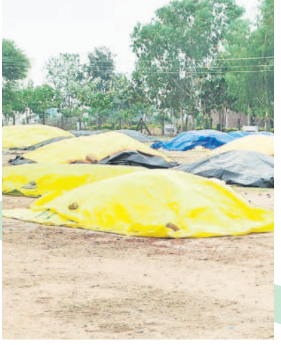
కుంటాలలో అరబోసిన ధాన్యాన్ని టార్పాలిన్ తో కప్పిన రైతు

దస్సురాబాద్, డిసెంబర్ 6 : మిగిలిన తుఫాను ప్రభావం వల్ల పంటలు నేలకొరకుతున్నాయి. ధాన్యం తడిసి ముద్దవుతున్నది. మంగళవారం రాత్రి కురిసిన వర్షానికి నిర్మల్ జిల్లా దస్సురాబాద్ మండలంలోని పలు గ్రామాల్లో కోత దశకు వచ్చిన వరి పంట నేలకొరిగింది. ధాన్యంపై కప్పిన కవర్లపై వర్షపు నీరు నిలిచింది. ధాన్యం బస్సాయి తడిశాయి. ధాన్యాన్ని కాపాడుకోవడానికి రైతులు అపవధులు పడ్డారు. అధికారులు చర్యలు తీసుకొని.. ధాన్యం కొనుగోళ్లను వేగవంతం చేయాలని రైతులు కోరుతున్నారు.