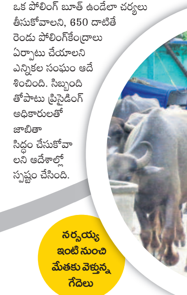
నర్సయ్య ఇంటి నుంచి మేతకు వెళ్తున్న గేదెలు

లను నిర్వహించేందుకు సిద్ధంగా ఉండాలని రాష్ట్ర ఎన్నికల సంఘం కలెక్టర్లకు ఉత్తర్వులు జారీ చేసింది. అందుకోసం రిటర్నింగ్ అధికారులు, పోలింగ్ సిబ్బందిని నియమించడంతోపాటు పంచాయతీ ఎన్నికల కోసం సచివ సిబ్బందికి క్షేత్ర ఇబ్బాలని సూచించింది. దీంతో పాటు పోలింగ్ కేంద్రాల పరిధిలో సిబ్బందిని నియమించడానికి సన్నద్ధమైన ఆదేశాలు జారీచేసింది. 200 ఓటర్లు ఉన్న పోలింగ్ స్టేషన్ పరిధిలో ఒక ప్రీసైడింగ్ అధికారి, ఇద్దరు పోలింగ్ అధికారులని నియమించాలని సూచించింది. అలాగే 201 నుంచి 400 మంది ఓటర్లు ఉన్న కేంద్రంలో ఒక ప్రీసైడింగ్ అధికారి, ముగ్గురు పోలింగ్ అధికారులను నియమించుకోవాలని ఆదేశించింది. ప్రతి వార్డులో ఒక పోలింగ్ బూత్ ఉండేలా చర్యలు తీసుకోవాలని, 650 డాటిలే రెండు పోలింగ్ కేంద్రాలు ఏర్పాటు చేయాలని ఎన్నికల సంఘం ఆదేశించింది. సిబ్బంది తోపాటు ప్రీసైడింగ్ అధికారులతో జూరీగా నియమించాలని, 650 డాటిలే రెండు పోలింగ్ కేంద్రాలు ఏర్పాటు చేయాలని ఎన్నికల సంఘం ఆదేశించింది. సిబ్బంది తోపాటు ప్రీసైడింగ్ అధికారులతో జూరీగా నియమించాలని, 650 డాటిలే రెండు పోలింగ్ కేంద్రాలు ఏర్పాటు చేయాలని ఎన్నికల సంఘం ఆదేశించింది.