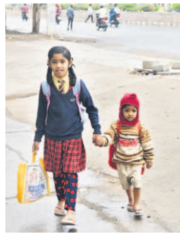
కరీంనగర్, డిసెంబర్ 6 (నమస్తే తెలంగాణ) / చొప్పదండి: మిగ్జాం తుఫాన్ ప్రభావంతో జిల్లా గజిగజా పబ్లికేషన్లు జనం ఇండ్ల నుంచి బయటికి వెళ్లాలని పరిస్థితి నెలకొన్నది. దీనికి తోడు తుఫాన్ కారణంగా జిల్లా వ్యాప్తంగా చిరుజల్లులు కురుస్తున్నాయి.

ఏండ్లుగా ఇక్కడి ఓటర్లు వినుతున్నారా తీర్పునిస్తున్నారు. ప్రతి ఎన్నికలోనూ కొత్త వారికి అవకాశం ఇస్తూ సరి కొత్త సంప్రదాయం కొనసాగిస్తున్నారు.