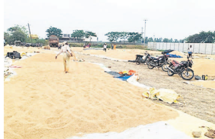
పెద్దపల్లి: వాన గెరువు ఇవ్వడంతో నిమ్మపల్లి తొమ్మిగోలు కేంద్రంలో వర్ష ఆరబోస్తున్న మహిళా రైతు

ఎప్పుటికప్పుడు సమీక్షిస్తున్నది. అన్ని జిల్లాల కలి కర్షణ ఎమ్మెల్యేలకు పర్యవేక్షిస్తున్నారు. కరీంనగర్ కలెక్టర్ పమెలా సత్యతి కొనుగోలు కేంద్రాలను పరిశీలించారు. 4 లక్షల మెట్రిక్ టన్నుల ధాన్యం కొనుగోలు కేంద్రాలను పరిశీలిస్తూ, ఇప్పుడున్న పరిస్థితుల్లో 2.25 లక్షల మెట్రిక్ టన్నులు వచ్చే అవకాశం కనిపిస్తుంది అధికారులు చెబుతున్నారు. కాగా, ఇప్పటికే 1.82 లక్షల మెట్రిక్ టన్నులు కొనుగోలు చేశారు. ఇంకా చాలా ధాన్యం కొనుగోలు కేంద్రాల్లోనే ఉండగా, తుఫాన్ బారినంది కాపాడుకునేందుకు రైతులు ఇబ్బందులు పడుతున్నారు. ధాన్యం కుప్పలపై టూర్నాలిస్టు కప్పే ఉంచుతున్నారు.