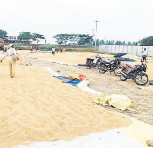
పెద్దవల్లి: వాన గెరువు ఇవ్వడంతో నిమ్మపల్లి కొనుగోలు కేంద్రంలో వడ్లు ఆరబోస్తున్న మహిళా రైతు

ఎప్పుటికప్పుడు సమీక్షిస్తున్నది. అన్ని జిల్లాల కలిపి సమాధింది. హుజూరాబాద్లో 2.2, మిల్లీమీటర్ల వర్షం పడింది. ఈ డివిజన్లోని మిగ్జాం మండలాల్లోని ఇల్లడకుంటలో 9.2, ఇమ్మిగంటలో 7.2, పింపడం లేదు. ధర్మవారం పగటి ఉష్ణోగ్రతలు 23 కు, రాత్రి ఉష్ణోగ్రతలు 20కి పడిపోయాయి. చలి విపరీతంగా పెరిగింది. ఈదురు గాలులు వీసినందుడంతో ప్రజలు ఇండ్ల నుంచి బయటికి రాకుండా ఉన్న దుస్తులు ధరించి జాగ్రత్తలు తీసుకుంటున్నారు. చిన్న పిల్లలు, వృద్ధులు తీవ్ర ఇబ్బందులు పడుతున్నారు.