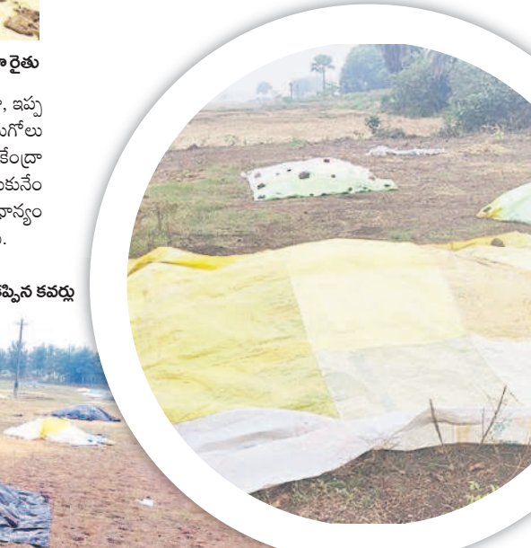
చొప్పదండి: ధాన్యం పై కప్పిన కవచం

రంగుమారుతున్న వరి నారు వానకాలం ధాన్యం సేకరణ దాదాపుగా ముగింపు దశకు వచ్చింది. ప్రస్తుతం యాసంగి ప్రాంతభవముతున్నది. నీటి సౌకర్యాన్ని బట్టి ఎప్పుటిలాగే కొంత మంది రైతులు కాస్త ముందుగానే యాసంగి నారు పోసుకున్నారు. పదిహేను రోజుల క్రితమే పోసిన నారు మరో 15, 20 రోజుల్లో పట్టు వేసుకునే దశకు చేరుకుంటుంది. ఈ దశలో మిగ్జాం తుఫాన్ ప్రభావంతో చలి పెరుగడం, మబ్బు పట్టి ఉంటుండడంతో అవసరమైనంత ఎండ నారుకు తగ్గడం లేదు. దీంతో ముందుగా పోసుకున్న నారు ఎరువు రంగుకు మారే ముప్పున్నదని ఆందోళన రైతుల్లో వ్యక్తమవుతున్నది. రంగు మారితే నత్రజని వాడాలైన పరిస్థితి వస్తుంది. కాస్త రంగు ఎక్కువ మారితే అది పని చేయదంటున్నారు. మరో వైపు ఈ సమయానికి నారు పోసుకునే రైతులు ప్రస్తుత చల్లని వాతావరణం తగ్గితే నారు పోయడానికి మొలకలు నానబెట్టుకోవడానికి ఎదురు చూస్తున్నారు. ఈ వాతావరణంలో పోస్తే మొలకల్లిన నారు చల్లడనానికి, చిరు జల్లులకు మురిగి పోతుందని చెబుతున్నారు. మిగ్జాం ప్రభావం ఎప్పుడు తగ్గకుండా..? అని ఎదురుచూస్తున్నారు.