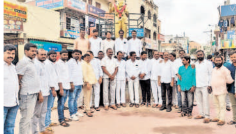
మేడ్చల్ లో అంబేద్కర్ విగ్రహం వద్ద నివాళులర్పిస్తున్న కౌన్సిల్ నాయకులు