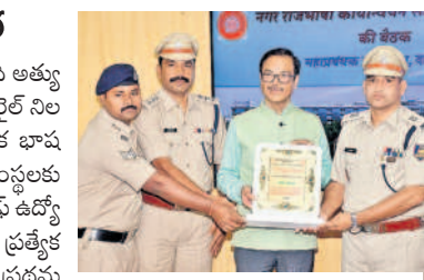
అవార్డును అందుకుంటున్న సీఆర్పీఎఫ్ అధికారులు