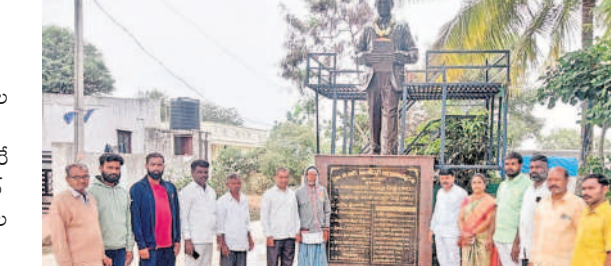
మేడ్చల్ రూరల్: మేడ్చల్ మండలంలోని మునీరాబాద్ గ్రామంలో అంబేద్కర్ విగ్రహానికి పూలమాల వేసి నివాళులర్పిస్తున్న నేతలు