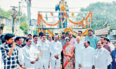
ఘట్కేసర్ లో అంబేద్కర్ విగ్రహం వద్ద నివాళులర్పిస్తున్న నాయకులు, ప్రతినిధులు