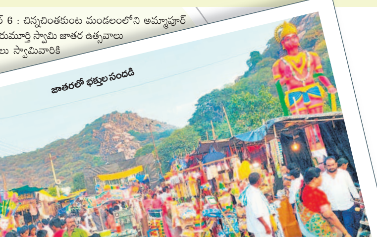
జాతరలో భక్తుల సందడి

దేవరకర్ణ రూరల్ (చిన్నచింతకుంట), డిసెంబర్ 6 : చిన్నచింతకుంట మండలంలోని అమ్మవూర్ గ్రామ సమీపంలో వేదల తిరువతిగా పేరుగాంచిన కురుమూర్తి స్వామి జాతర ఉత్సవాలు కొనసాగుతున్నాయి. బుడవారం ఆలయ ఆర్యకులు స్వామివారికి నిత్యకైతకర్మాలతోపాటు ప్రత్యేక పూజలు నిర్వహించారు. వివిధ ప్రాంతాల నుంచి వచ్చిన భక్తులు పుణ్య స్నానాలు ఆచరించి స్వామివారి దర్శనానికి బారులు తీరారు. జాతరంకా యాత్రకులతో కిటికీలు కూర్చుండి స్వామివారి దర్శనం చేసుకున్న ఆనంతరం భక్తులు జాతరలో పలు దుకాణాల్లో వస్తువులు కొనుగోలు చేశారు.