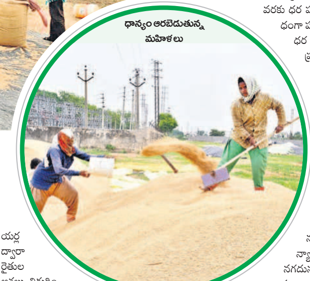
ధాన్యం ఆరబెడుతున్న మహిళలు

విగా పరిధాన్యాన్ని పండిస్తుండడంతో ధాన్యం అందగా మారింది. ప్రతి ఏటా జిల్లాలో వరి పండించే రైతుల సంఖ్య పెరుగుతూనే ఉంది. ప్రత్యామ్నాయ పంటలు చేయాలని, లాభదాయకమైన పంటల సాగు చేపట్టాలని వ్యవసాయ అధికారులు సూచిస్తున్నప్పటికీ రైతులు వరి వైపే మొగ్గు చూపుతున్నారు. ఈ ఏడాది వానకాలంలో వర్షాభావ పరిస్థితులు వెంటాడాయి. అలస్యంగా పంటలు సాగునీరు అందించి కాపాడారు. ఒక దశలో పంటలు ఎండిపోతాయని ఆందోళన చెందినప్పటికీ వరుణుడు కరుణించడంతోపాటు రిజర్వాయర్లను ఏర్పాటు చేశారు. రైతులకు పంటలు సాగునీరు విడుదల చేసి గత ప్రభుత్వం మద్దతుగా నిలిచింది. దీంతో మహబూబ్ నగర్ జిల్లాలో 1,90,000 ఎకరాలు, నారాయణపేట జిల్లాలో 1,87,544 ఎకరాలు, గద్వాల జిల్లాలో 80వేల, నాగర్ కర్నూల్ జిల్లాలో 1,55,522 ఎకరాల్లో వరిని సాగు చేశారు. భీమా, కోయల్ సాగర్, కల్వకుర్తి, నెల్లంపాడు, జూలూరు కుడి, ఎడమ కాల్వలు కింద వరి పంటను సాగు చేశారు.