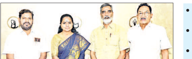
హైదరాబాద్ లో ఎమ్మెల్యే కవితతో టీబీజేకేఎస్ నాయకులు