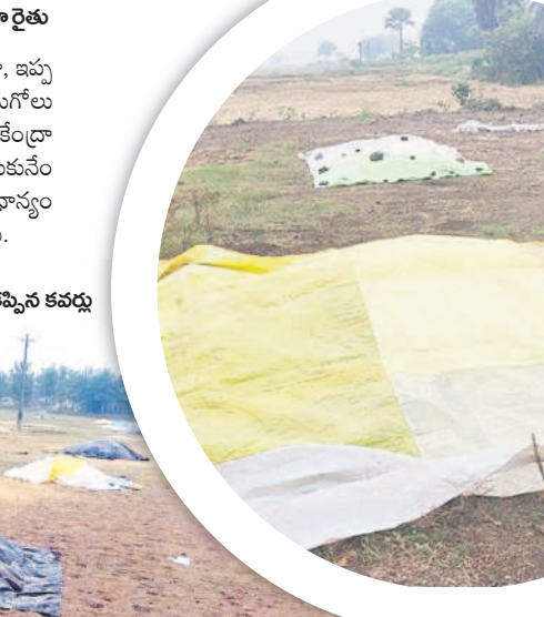
సారంగాపూర్: అక్కడక్కడా కొనుగోలు కేంద్రాల్లో ధాన్యం కుప్పలపై కప్పిన కవచం

రంగుమారుతున్న వరి నారు వానకాలం ధాన్యం సేకరణ దాదాపుగా ముగింపు దశకు వచ్చింది. ప్రస్తుతం యాసంగి ప్రాంతభవముతున్నది. నీటి సౌకర్యాన్ని బట్టి ఎప్పుటిలాగే కొంత మంది రైతులు కాస్త ముందుగానే యాసంగి నారు పోసుకున్నారు. పదిహేను రోజుల క్రితమే పోసిన నారు మరో 15, 20 రోజుల్లో పట్టు వేసుకునే దశకు చేరుకుంటుంది. ఈ దశలో మిగ్జాం తుఫాన్ ప్రభావంతో చలి పెరుగడం, మబ్బు పట్టి ఉంటుండడంతో అవసరమైనంత ఎండ నారుకు తగ్గడం లేదు. దీంతో ముందుగా పోసుకున్న నారు ఎరువు రంగుకు మారే ముప్పున్నదని ఆందోళన రైతుల్లో వ్యక్తమవుతున్నది. రంగు మారితే నత్రజని వాడాలైన పరిస్థితి వస్తుంది. కాస్త రంగు ఎక్కువ మారితే అది పని చేయదంటున్నారు. మరో వైపు ఈ సమయానికి నారు పోసుకునే రైతులు ప్రస్తుత చల్లని వాతావరణం తగ్గితే నారు పోయడానికి మొలకలు నానబెట్టుకోవడానికి ఎదురు చూస్తున్నారు. ఈ వాతావరణంలో పోస్తే మొలకలైన నారు చల్లడనానికి, చిరు జల్లులకు మురిగి పోతుందని చెబుతున్నారు. మిగ్జాం ప్రభావం ఎప్పుడు తగ్గకుండా..? అని ఎదురుచూస్తున్నారు.