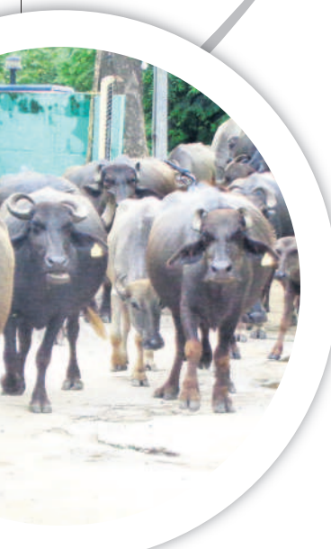
సర్పయ్య ఇంటి నుంచి మేతుకు వెళ్తున్న గేదెలు

రెడీ అవుతున్న అధికారులు ఎన్నికల సంఘం ఆదేశాలు జారీచేసిన నేపథ్యంలో జిల్లా అధికారులు అందుకు అనుగుణంగా సిద్ధమవుతున్నారు. సర్పంచ్ ఎన్నికలు ఏ సమయంలోనైనా వచ్చే అవకాశమున్న నేపథ్యంలో వాటిని సమర్థవంతంగా నిర్వహించేందుకు ఏర్పాట్లు చేస్తున్నారు. 2019 వాటి ఎన్నికలతో పోలిస్తే ఈ సారి ఓటర్లు పెద్ద సంఖ్యలో పెరిగారు. ఈ నేపథ్యంలో వార్డుల వారీగా ఉన్న ఓటర్ల వివరాలను ఆయా జిల్లాల పంచాయతీరాజ్ శాఖ సిద్ధం చేస్తున్నది. దీంతో పాటు పంచాయతీ ఎన్నికల్లో వార్డులు, పంచాయతీలు రిజిస్ట్రేషన్ ప్రకటించాల్సి ఉంటుంది. దీనికోసం అధికారులు గణాంకాలను తీసుకున్నారు. అయితే ఎన్నికలు నిబంధనల ప్రకారం ఇన్ టైంలో జరుగుతాయా..? లేదా..? అన్నది మాత్రం నూతనంగా ఏర్పడుతున్న ప్రభుత్వం తీసుకునే నిర్ణయాల్పై ఆధారపడి ఉండవచ్చు.