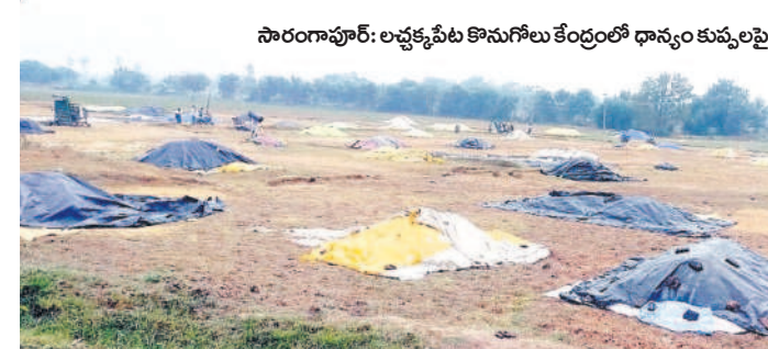
సారంగాపూర్: అక్కడక్కడా కొనుగోలు కేంద్రాల్లో ధాన్యం కుప్పలపై కప్పిన కవచం

ఎప్పుటికప్పుడు సమీక్షిస్తున్నది. అన్ని జిల్లాల కలిపి సమాధింది. హుజూరాబాద్లో 2.2, మిల్లిమీటర్ల వర్షం పడింది. ఈ డివిజన్లోని మిగ్జాం మండలాల్లోని ఇల్లడకుంటలో 9.2, ఇమ్మికుంటలో 7.2, పింపడం లేదు. భద్రవారం పగటి ఉష్ణోగ్రతలు 23 కు, రాత్రి ఉష్ణోగ్రతలు 20కి పడిపోయాయి. చలి విపరీతంగా పెరిగింది. ఈదురు గాలులు వీసినందున ప్రజలు ఇండ్ల నుంచి బయటికి రాకుండా ఉన్న దుస్తులు భరించని జాగ్రత్తలు తీసుకుంటున్నారు. చిన్న పిల్లలు, వృద్ధులు తీవ్ర ఇబ్బందులు పడుతున్నారు.