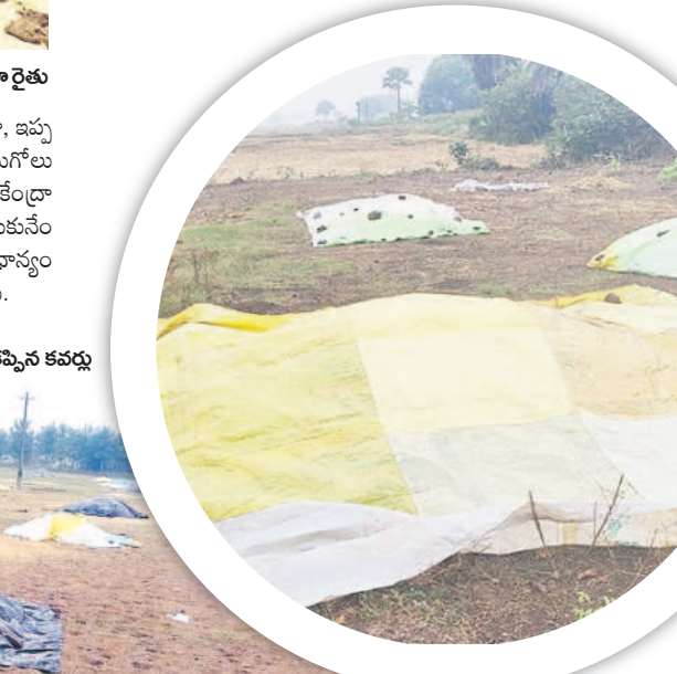
చొప్పదండి: ధాన్యం పై కప్పిన కవచం

రంగుమారుతున్న వరి నారు వానకాలం ధాన్యం సేకరణ దాదాపుగా ముగింపు దశకు వచ్చింది. ప్రస్తుతం యాసంగి ప్రాంతభవముతున్నది. నీటి సౌకర్యాన్ని బట్టి ఎప్పుటిలాగే కొంత మంది రైతులు కాస్త ముందుగానే యాసంగి నారు పోసుకున్నారు. పదిహేను రోజుల క్రితమే పోసిన నారు మరో 15, 20 రోజుల్లో పచ్చి మేనుకునే దశకు చేరుకుంటుంది. ఈ దశలో మిగ్జాం తుఫాన్ ప్రభావంతో చలి పెరుగడం, మబ్బు పట్టి ఉంటుండడంతో ఆపసరమైనంత ఎండ నారుకు తగ్గడం లేదు. దీంతో ముందుగా పోసుకున్న నారు ఎరువు రంగుకు మారే ముప్పున్నదని ఆందోళన రైతుల్లో వ్యక్తమవుతున్నది. రంగు మారితే నత్రజని వాడాలైన పరిస్థితి వస్తుంది. కాస్త రంగు ఎక్కువ మారితే అది పని చేయదంటున్నారు. మరో వైపు ఈ సమయానికి నారు పోసుకునే రైతులు ప్రస్తుత చల్లని వాతావరణం తగ్గితే నారు పోయడానికి మొలకలు నానబెట్టుకోవడానికి ఎదురు చూస్తున్నారు. ఈ వాతావరణంలో పోస్తే మొలకల్లిన నారు చల్లడనానికి, చిరు జల్లులకు మురిగి పోతుందని చెబుతున్నారు. మిగ్జాం ప్రభావం ఎప్పుడు తగ్గకుండా..? అని ఎదురుచూస్తున్నారు.