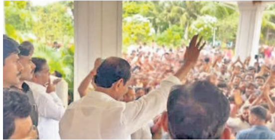
చింతమడక గ్రామస్థులకు అభివాదం చేస్తున్న గూలాబీ నేత కేసీఆర్

సిద్దిపేటరూరల్/మర్నాక్, డిసెంబర్ 6: కేసీఆర్ ను చూసేందుకు ఎర్రపల్లికి బుధవారం సీఎం కేసీఆర్ సొంత గ్రామం చింతమడక గ్రామస్థులు 9 బస్సుల్లో 540 మంది తరలివెళ్లారు. తన స్వగ్రామం నుంచి ప్రజలు వచ్చారనే విషయం తెలుసుకున్న కేసీఆర్ నివాసం నుంచి బయటకు వచ్చి గ్రామస్థులకు