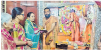
దుర్గామాతను దర్శించుకున్న మెడక్ జిల్లా ప్రధాన న్యాయమూర్తి