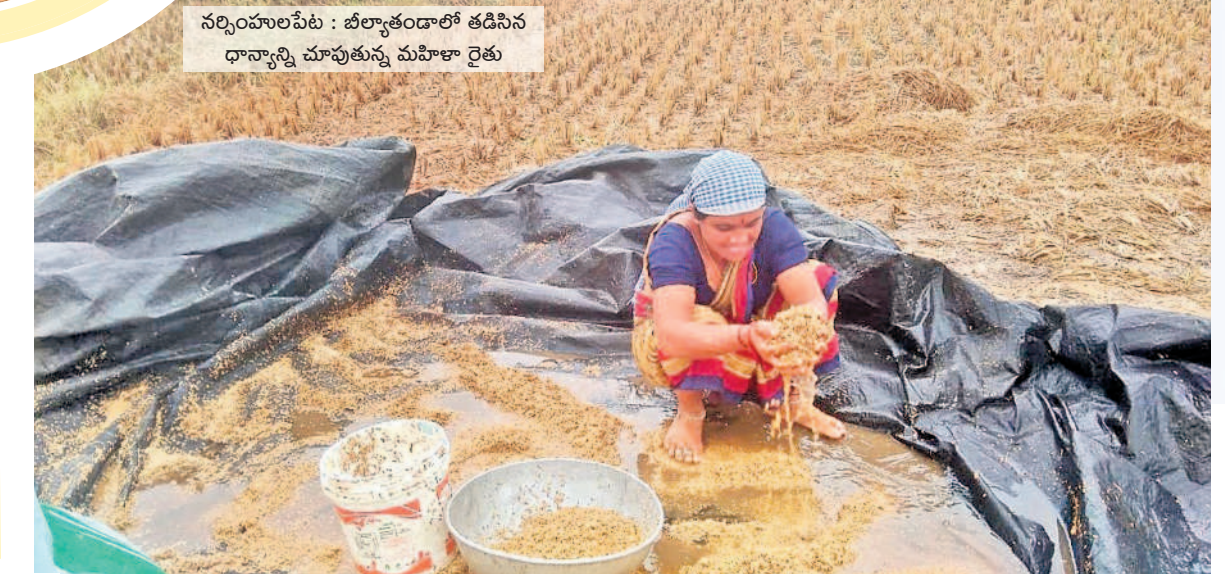
నర్సంహలపేట : బీల్కాకొండలో తడిసిన ధాన్యాన్ని చూపుతున్న మహిళా రైతు