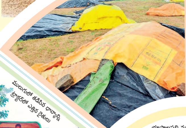
ములుగులో తడిసిన ధాన్యాన్ని ట్రాక్టర్లలో ఎత్తిన రైతులు