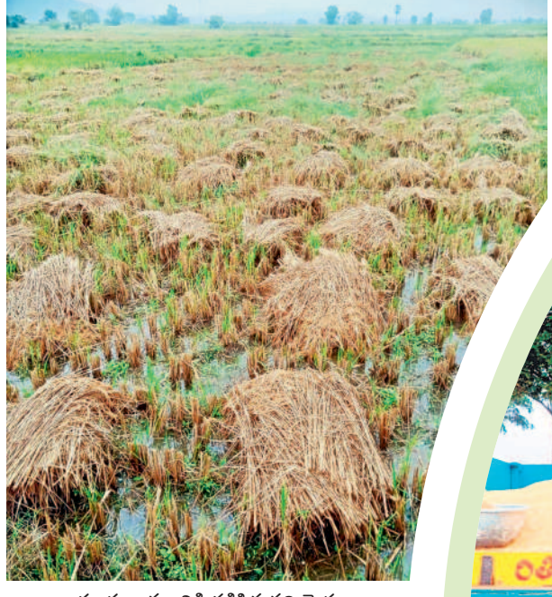
బయ్యారం : వర్షానికి తడిసిన వరి మెదలు