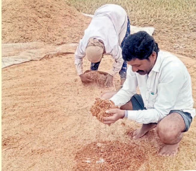
మహబూబాబాద్ మండలం బలరాం తండాలో తడిసిన వడ్లను చూపుతున్న రైతు