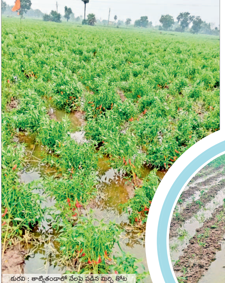
కురవి : తాటికొండలో నేలపై సడిన మిర్చి తోట