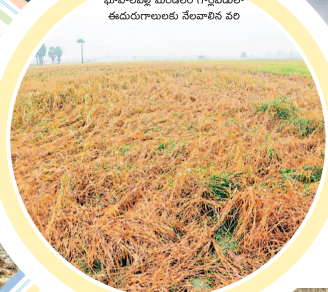
భూపాలపల్లి మండలం గొడ్లవీడులో ఈదురుగాలులకు నేలవాల్సిన వరి