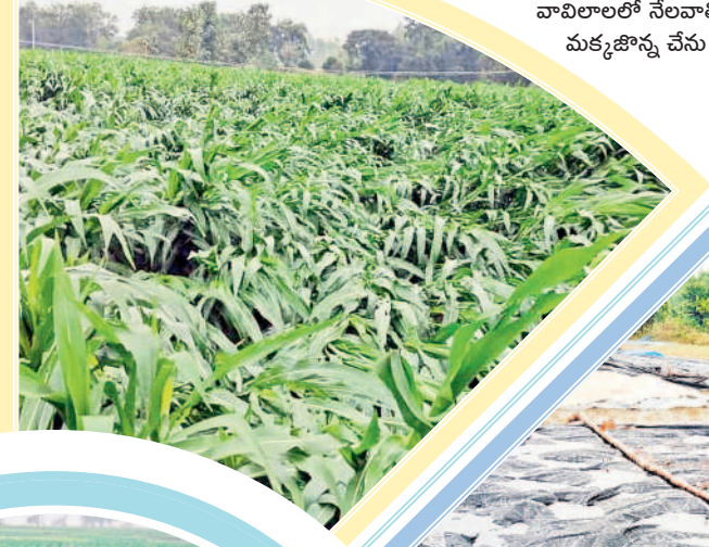
నెల్లికుదురు మండలం వావిలాలలో నేలవాల్సిన మక్కజొన్న చేను