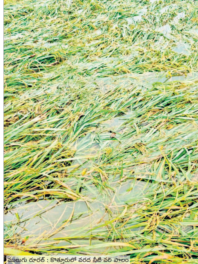
ములుగు రూరల్ : కొత్తూరులో వరద నీటి వరి పాలం