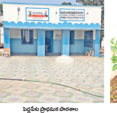
పెద్దపేట ప్రాథమిక పాఠశాల