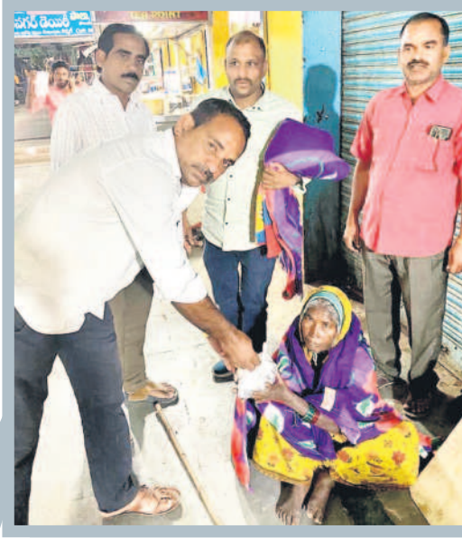
నిరుపేదలు, యూచకులకు ఆహార ప్యాక్లను అందిస్తున్న పుడ్ బ్యాంక్ వాలంటీర్లు

'సెలవు దినం... సేవకు అంకితం' పేరిట ప్రత్యేక భోజనాన్ని తయారు చేయించి నిర్మల్ కు నాలుగు వైపులా భోజనాన్ని పంపిణీ చేస్తున్నారు. అలాగే పుడ్ బ్యాంక్ నిర్మల్ సంస్థలో సేవా భావాల ఉన్నవారి పుట్టిన రోజులు, పెళ్లి రోజు వేడుకలను జరుపుకునే విధంగా కూడా చూస్తున్నారు. వీరిచే విరాళాలతో అధివారం ప్రత్యేక భోజనాన్ని తయారు చేయిస్తున్నారు. ఏడేళ్ల నుంచి తమ జీతం నుంచి ప్రతినెల కొంత జమ చేయడమే కాకుండా, స్వచ్ఛందంగా వాతపిచ్చి నిరాశాలతో పుడ్ బ్యాంక్ నిర్వహణను నిరాటంకంగా కొనసాగుతున్నారు. కాగా.. ఇప్పటివరకు అధివారం మాత్రమే భోజనం అందించామని, మా సంస్థ ప్రారంభించి ఏడేళ్ల పూర్తి చేసుకొని ఎనిమిదో సంవత్సరంలోకి అడుగుతున్న సందర్భంగా జనవరి 1 నుంచి ప్రతి రోజూ అందిస్తామని నిర్వాహకులు తెలిపారు.