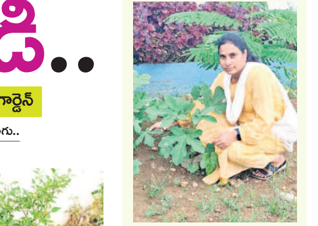
విద్యార్థులకు పోషకాహారం అందించడమే లక్ష్యం

మధ్యాహ్న భోజనంలో భాగంగా పాఠశాల విద్యార్థులకు తాజా ఆకుకూరలు, కూరగాయలతో భోజనం పెట్టేందుకు పాఠశాలలోని కిచెన్ గార్డెన్ లో