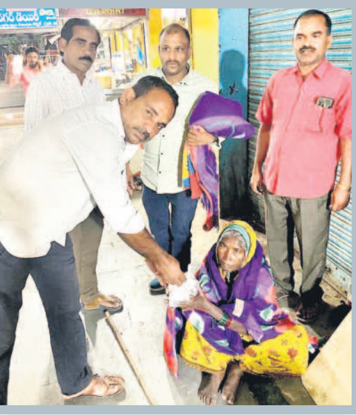
నిరుపేదలు, యువకులకు ఆహార పోషకాలను అందిస్తున్న పుడ్ బ్యాంక్ వాలంటీర్లు

'సెలవు దినం... సేవకు అంకితం' పేరిట ప్రత్యేక భోజనాన్ని తయారు చేయించి నిర్మల్ కు నాలుగు వైపులా భోజనాన్ని పంపిణీ చేస్తున్నారు. అలాగే పుడ్ బ్యాంక్ నిర్మల్ సంస్థలో సేవా భావాల ఉన్నవారి పుట్టిన రోజులు, పెళ్లి రోజు వేడుకలను జరుపుకునే విధంగా కూడా చూస్తున్నారు. వీరితో విరాళాలతో ఆదివారం ప్రత్యేక భోజనాన్ని తయారు చేయిస్తున్నారు. ఏడేళ్ల నుంచి తమ జీతం నుంచి ప్రతినెల కొంత జమ చేయడమే కాకుండా, స్వచ్ఛందంగా వాతపిచ్చి నిరాశాలతో పుడ్ బ్యాంక్ నిర్వహణను నిర్వహించగా కొనసాగుతున్నారు. కాగా.. ఇప్పటివరకు ఆదివారం మాత్రమే భోజనం అందించామని, మా సంస్థ ప్రారంభించిన ఏడేళ్ల పూర్తి చేసుకొని ఎనిమిదో సంవత్సరంలోకి అడుగుతున్న సందర్భంగా జనవరి 1 నుంచి ప్రతి రోజు అందిస్తామని నిర్వహకులు తెలిపారు.