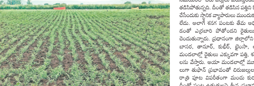
తుఫాన్ కారణంగా మంచు కురువడంతో తేమ ఎక్కువై ఎర్రబారుతున్న శనగ పంటలు

డాలు కాకుండా, ఉదయం నుంచి రాత్రి వరకు శీత దృశ్యమైన పొగమంచు మ్యూనుడంతో వాహనదారులు నిలిచి బయటకు వచ్చేందుకు ఇంకుతున్నారు.