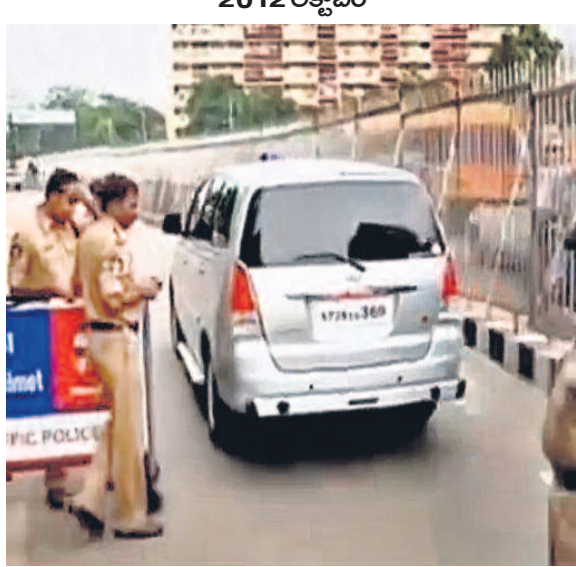
2012 అక్టోబర్ నాటి వీడియోలో హైదరాబాద్ లోని ఉమ్మడి ఆంధ్రప్రదేశ్ సీఎం క్యాంప్ కార్యాలయం ముందు చుట్టూగా కలిపిస్తున్న ఐదవ ఫెన్సింగ్

గిరిజన వర్చిటీకి లోక్ సభ ఆమోదం సమృద్ధి సాధక వర్చిటీపై > 2 ఫలింబిన బీఆర్ఎస్ సారాటం నెరవేరిన తెలంగాణ ప్రజల కల