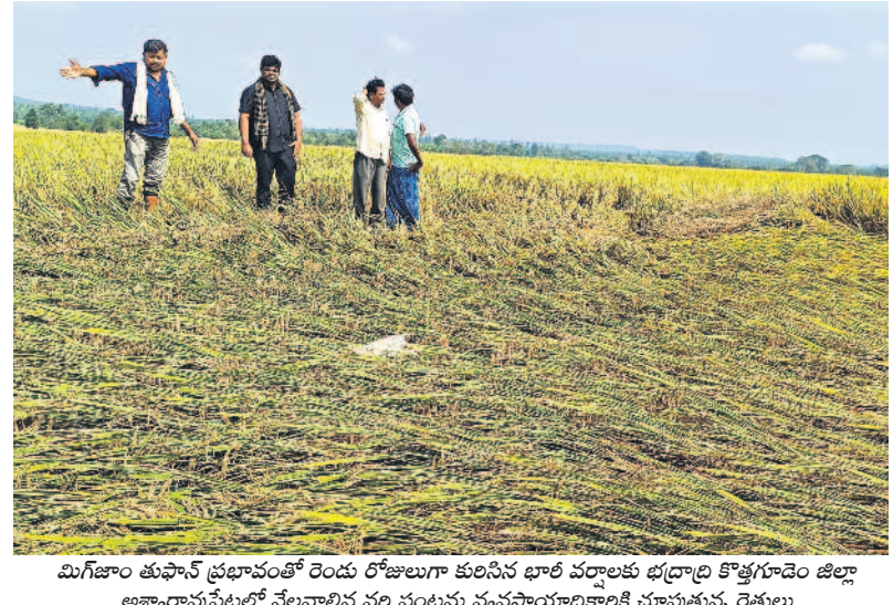
మిగిలిన తుఫాన్ ప్రభావంతో రెండు రోజులుగా కురిసిన భారీ వర్షాలకు భద్రాద్రి కొత్తగూడెం జిల్లా అగ్రారావుపేటలో నేలవాలిన పల పంటను వ్యవసాయాధికారికి చూపుతున్న రైతులు

రేవంత్.. ఇదేం అహంకారం? దేశాన్ని చీల్చాలనుకుంటున్నారా? 'బీహార్ డీఎన్ ఐ' వ్యాఖ్యలపై కేంద్రమంత్రి రవిశంకర్ ధ్వజం > 2 క్షమాపణలు చెప్పాలని డిమాండ్ బీహార్ ప్రజల మనోభావాల్ని దెబ్బతీశారు: కేంద్రమంత్రి చౌదరి