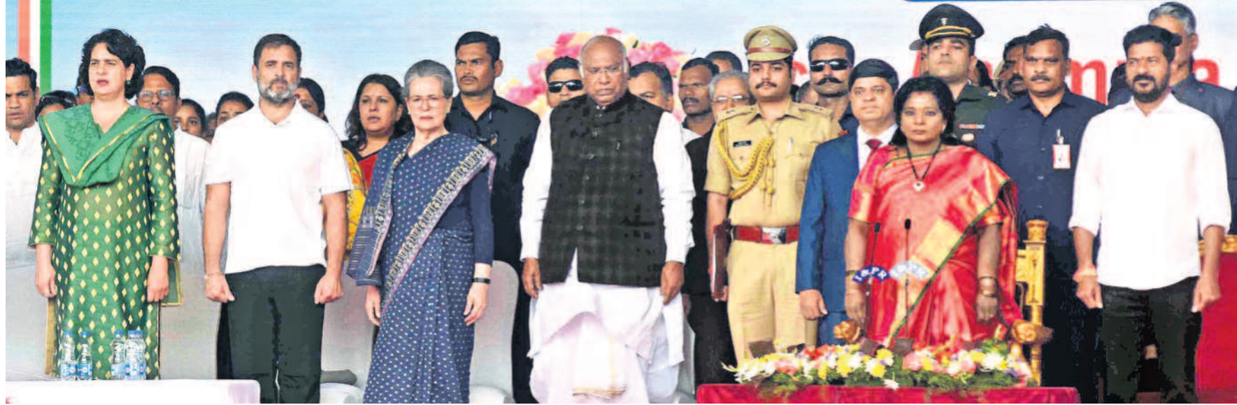
గురువారం హైదరాబాద్ ఎల్ టీ వై డియల్ ముఖ్యమంత్రిగా రేవంత్ రెడ్డి ప్రమాణస్వీకార కార్యక్రమంలో గవర్నర్ తమిళిసైతోపాటు అతిథులుగా హాజరైన కాంగ్రెస్ అధినేత్రీ సోనియాగాంధీ, పార్టీ జాతీయ అధ్యక్షుడు మల్లికార్జున్ ఖర్గే, ముఖ్యనేతలు రాహుల్ గాంధీ, ప్రయోగ్ గాంధీ తదితరులు

శుక్రవారం, సూర్యోదయం: 8-84, సూర్యాస్తమయం: 5-41. శ్రీ శోభకృత్ నామ సంవత్సరం దక్షిణాయనం శరద రుతువు కార్తీక మాసం కృష్ణ పక్షం తిథి: ఏకాదశి మర్యాద ఉదయం 8-31 వరకు, నక్షత్రం: హస్త ఉదయం 8-54 వరకు, తదుపరి చిత్త. వర్జ్యం: సాయంత్రం 5-31 నుంచి రాత్రి 7-14 వరకు, రాహుకాలం: ఉదయం 10-44 నుంచి పగలు 12-07 వరకు. దుర్భుధాధి: ఉదయం 8-47 నుంచి ఉదయం 9-32 వరకు, పునర్ దుర్భుధాధి: పగలు 12-29 నుంచి పగలు 1-14 వరకు. అమృతకాలం: తెల్లవారుజామున 3-49 నుంచి తెల్లవారుజామున 5-33 వరకు.