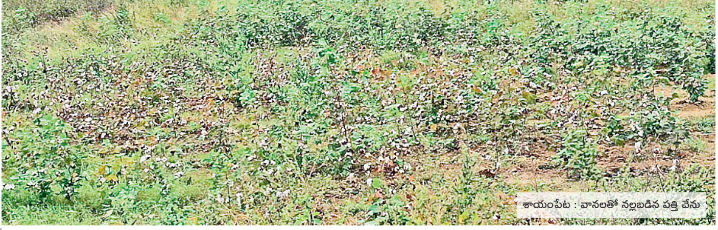
శాయంపేట : వానలతో నల్లబారిన పత్తి చేను

చిన్నగూడూరు : తడిసిన వరి ధాన్యాన్ని చూపుతున్న రైతు కుటుంబం