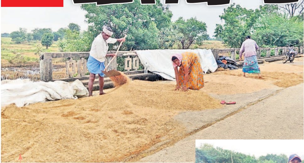
బయ్యారం : తడిసిన వరి ధాన్యాన్ని ఆరబెడుతున్న రైతులు