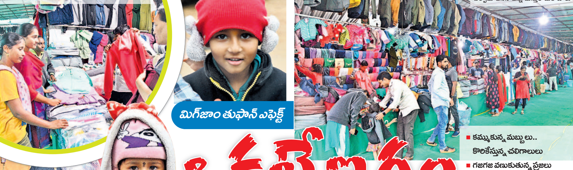
మిగజాం తుఫాన్ ఎఫెక్ట్

అశోకా థియేటర్ వద్ద ఏర్పాటు చేసిన దుకాణం.. ఉన్ని దుస్తులు కొంటున్న వినయోగదారులు