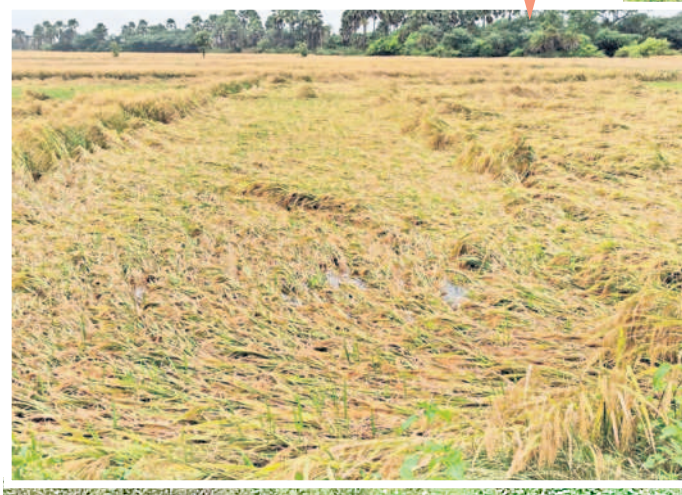
శాయంపేట : ఆరపెట్టిన నీటిలో తేలుతున్న వరి పంట