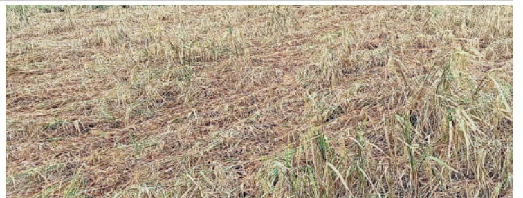
తురుకల సామారంలో అకాల వర్షంతో నీలవాలిన వరి పంట

పర్వతగిరి, డిసెంబర్ 7 : మండలంలోని పలు గ్రామాల్లో అకాల వర్షంతో అన్నదాతకు నష్టం వాటిల్లింది. పలు గ్రామాల్లో చేతికందే దశలో ఉన్న వరి పంట అకాల వర్షంతో పంట నీలవారింది. రైతులు ధాన్యం విక్రయించడానికి కొనుగోలు కేంద్రాల వద్దకు తీసుకువచ్చిన క్రమంలో అకాల వర్షంతో వరి ధాన్యం తడిసిందని పలువురు రైతులు ఆవేదన వ్యక్తం చేశారు.