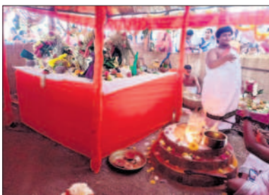
విగ్రహ ప్రతిష్ఠాపన పూజలు చేస్తున్న అర్చకులు