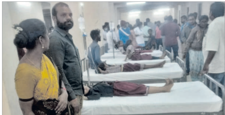
జిల్లా కేంద్ర దవాఖానలో చికిత్స పొందుతున్న విద్యార్థులు

మోపాల్ (ఖలీల్ వాడి), డిసెంబర్ 7 : బోర్డం ప్రభుత్వ పాఠశాలలో గురువారం మధ్యాహ్నం విద్యార్థులు అస్వస్థతకు గురయ్యారు. మధ్యాహ్నం భోజనం చేసిన 2 గంటల తర్వాత ఇద్దరు విద్యార్థులు కడుపులో నొప్పి వస్తుందని చెప్పగా ఉపాధ్యాయులు డాక్టర్