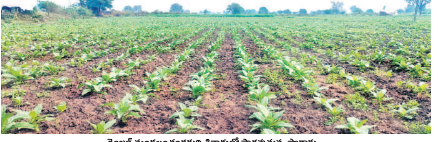
రెంజెల్ మండలం కందకర్తి శివారులో సాగువుతున్న పొగాకు