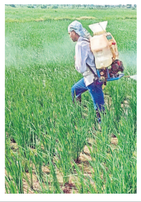
క్రిమినంహారక మందును పిచికారీ చేస్తున్న రైతులు