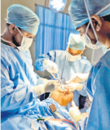
వేములవాడ ఏరియా దవాఖానలో మోకాలు కీలు మార్పిడి శస్త్ర చికిత్సలు చేస్తున్న వైద్యులు

ఇప్పటిదాకా మోకాలు కీలు మార్పిడి శస్త్ర చికిత్స అంటే హైదరాబాద్ లాంటి కార్పొరేట్ దవాఖానల్లో మాత్రమే చేసేవారు. కానీ, బీఆర్ఎస్ ప్రభుత్వం చేపట్టిన చర్యలతో వేములవాడ ఏరియా దవాఖానలో ఈ సేవలను అందుబాటులోకి తెచ్చారు. ఇక్కడి వైద్య బృందం అధ్వర్యంలో ఇప్పటి వరకు 25 మందికి మోకాలు కీలు మార్పిడి శస్త్ర చికిత్సలు విజయవంతం చేశారు. రాజస్థాన్ సిరిస్టిల్ జిల్లా నుంచే కాకుండా ఇతర జిల్లాల నుంచి వచ్చి ప్రభుత్వ దవాఖానల్లో వైద్య సేవలు అందుతున్నారు. ఈ శస్త్ర చికిత్సల కోసం మరో 60 మంది రోగులు వెయిటింగ్ లో ఉన్నట్లు వైద్యులు తెలిపారు.