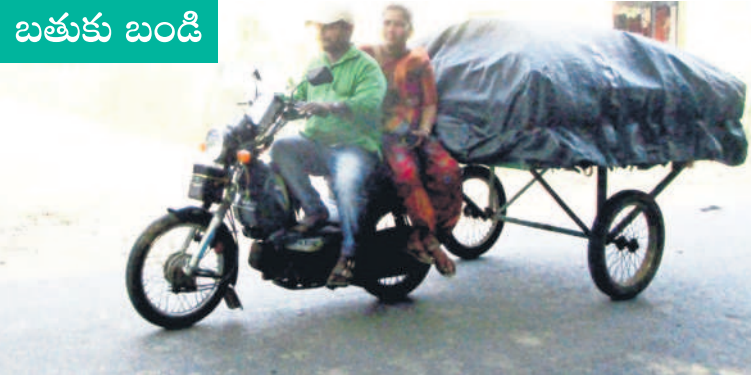
ఓడెల: మోపెడ్ బండిపై వారసంతకు వెళ్తున్న దంపతులు

బతుకు బండిని లాగేందుకు ఓ దంపతులు ద్వితీయ ప్రాధాన్యతను ఇలా మార్చుకుని చిరు వ్యాపారం చేసుకుంటున్నారు. మోపెడ్ బండికి ట్రాక్టర్ ట్రాలీ మాదిరిగా చేయించి ఇలా అమ్మారు. వారం, వారం గ్రామాల్లో జరిగే వారసంతకు వివిధ రకాల వస్తువులను ఈ వాహనంపైనే తీసుకెళ్తున్నారు. ఈ క్రమంలో ఓడెల మండల కేంద్రానికి దంపతులద్వారా ఆ వాహనంపై వస్తున్నప్పుడు దృశ్యాన్ని 'నమస్తే తెలంగాణ' తన కెమెరాలో బంధించింది.