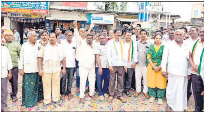
ఎన్ గేడు : అలెక్సాండర్ కూడలిలో సంబురాలు చేసుకుంటున్న నాయకులు

మంత్రివర్గంలో శ్రీధర్ బాబు, పొన్నం ప్రభాకర్ కు చోటు