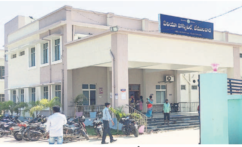
వేములవాడ ఏరియా దవాఖాన

వేములవాడ, డిసెంబర్ 7: వేములవాడలో ₹22.50కోట్లతో వంద పడకల ఏరియా దవాఖానను భవనాన్ని నిర్మించి, వేదలకు కార్పొరేట్ కు టీటుగా వైద్యసేవలు అందిస్తున్నారు. లక్షలాది రూపాయల విలువైన కీలకమైన చికిత్సను పూర్తి ఉచితంగా చేస్తున్నారు. పదుల సంఖ్యలో మోకాలు మార్పిడి ఆపరేషన్లు చేశారు. ఫైవేట్ కు మించి ప్రసవాలు కూడా చేస్తున్నారు. ఇంకా కంటి, దంత, ఇతర చికిత్సలను కూడా చేస్తున్నారు. ఈ దవాఖానకు నిత్యం 500 మందికి పైగా వస్తున్నారు. ప్రాణాంతకమైన క్యాన్సర్, పెరలాసిస్, ఇతర దీర్ఘకాలిక వ్యాధులతో కడలేని స్థితిలో ఏండ్ల కేండ్ల మంచానడవడంలో కోసం ఇదే దవాఖానలో పాలియేటివ్ కేర్ సెంటర్ ఏర్పాటు చేసి సేవలందిస్తున్నారు.