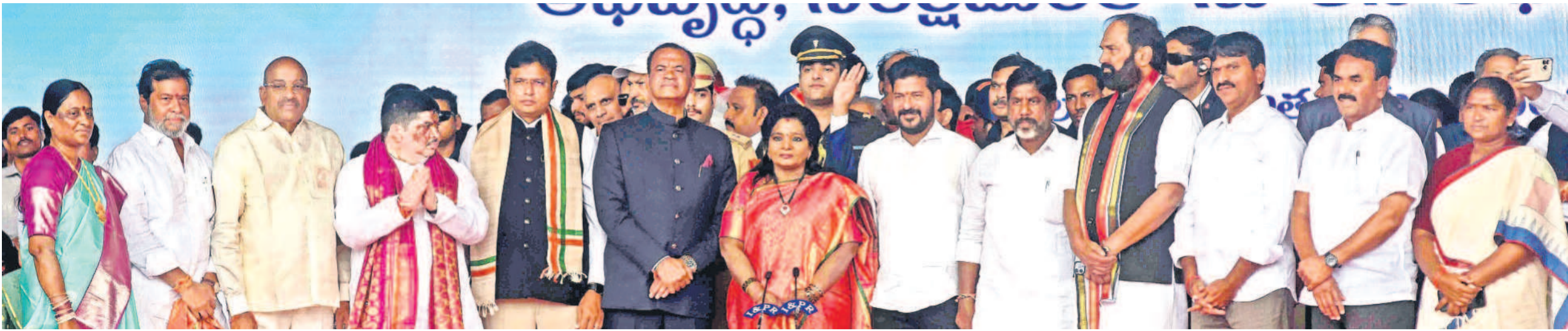
హైదరాబాద్ లోని ఎల్.టి.సి. డి.ఎం.ఎల్.లో గురువారం ప్రమాణ స్వీకారం చేసిన అనంతరం గవర్నర్ తమిళిస్సై సాందర్ రాజన్ తో ముఖ్యమంత్రి ఎన్.మొదల రేవంత్ రెడ్డి, ఉప ముఖ్యమంత్రి భట్టి విక్రమార్క, మంత్రులు ఉత్తమకుమార్ రెడ్డి, పొంగులేటి శ్రీనివాస్ రెడ్డి, జూపల్లి కృష్ణారావు, ధనసరి అనసూయ (సీతక్క), కోమటిరెడ్డి వెంకటరెడ్డి, దుర్జిత శ్రీధర్ బాబు, పాన్సం ప్రభాకర్, తుమ్మల నాగేశ్వరరావు, దామోదర రాజనరసింహ, కొండా సురేఖ గ్రూప్ ఫౌండర్