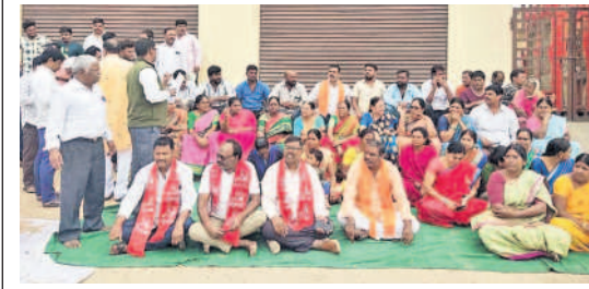
వైసీపీ అనుమతులు రద్దు చేయాలని కోరుతూ ఉప్పల్ మున్సిపల్ ఆఫీస్ ముందు ధర్నా చేస్తున్న మహిళలు