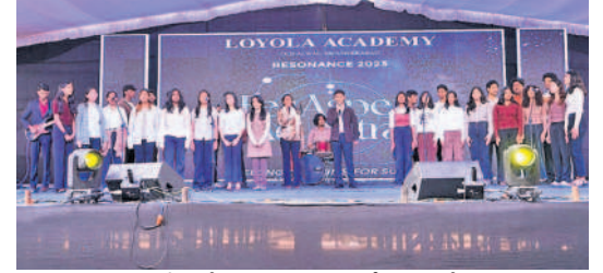
లయోలా కాలేజీలో జరిగిన యువజనోత్సవంలో విద్యార్థులు