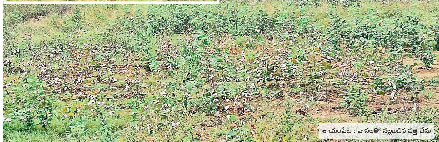
శాయంపేట : వానలతో నల్లబారిన పత్తి చేను