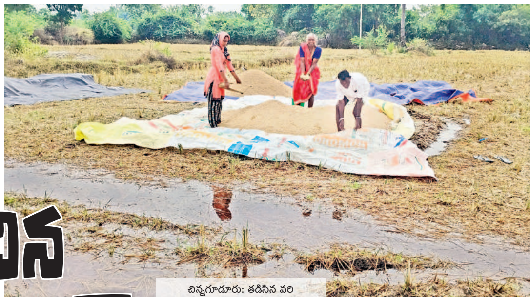
చిన్నగూడూరు: తడిసిన వరి ధాన్యాన్ని చూపుతున్న రైతు కుటుంబం