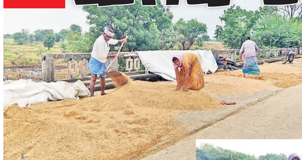
బయ్యారం : తడిసిన వరి ధాన్యాన్ని ఆరబెడుతున్న రైతులు శాయంపేట : ఆరపల్లిలో నీటిలో తేలుతున్న వరి పంట