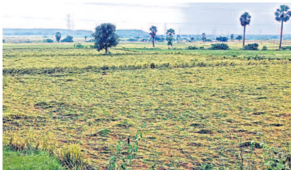
రాగడపలో నేలవాలిన వరిచేసు