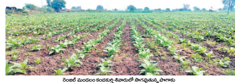
రెంజిల్ మండలం కందకర్తి శివారులో సాగువుతున్న పొగాకు