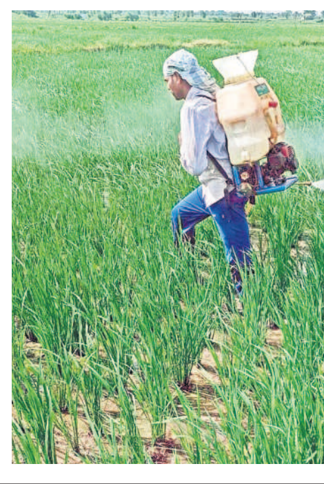
క్రిమినంహారక మందును పిచికారీ చేస్తున్న రైతులు