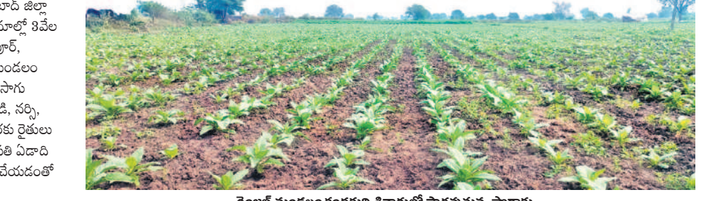
రెంజల్ మండలం కండకల్ల శివారులో సాగుతున్న పొగాకు