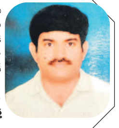
శ్రీకృష్ణ కృషి విజ్ఞాన కేంద్రం శాస్త్రవేత్త

రైతులు ఒకే రకమైన పంటలు సాగుచేయడం ద్వారా ఆ పంట మొక్కలకు అవసరమైన పోషకాలు తక్కువవుతాయి. రోగకారక పురుగుల ఉధృతి పెరిగి దిగుబడి తగ్గుతుంది. వరుసగా ఒకే పంటను కాకుండా వివిధ రకాల పంటల సాగుతో పురుగుల జీవిత చక్రాన్ని నిలిపివేయవచ్చు. దాంతో రైతులు మంచి లాభాలను పొందగలుగుతారు. రైతులు