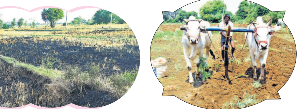
సూర్య నెట్వర్క్, డిసెంబర్ 7

కొయ్యలను కాల్యడంతో అనర్థాలు.. పొలంలో కొయ్యలను కాల్యడం అత్యంత ప్రమాదకర స్థాయికి చేరుకున్నదని శాస్త్రవేత్తలు, సామాజికవేత్తలు అందోళన వ్యక్తం చేస్తున్నారు. రైతులు అవగాహన లేమితో పంటలు ఎంతో మేలు చేసే కొయ్యలను భూమిలో కలియదున్నట్లుగా కాలివేసి భవిష్యత్తు పంటలను నాశనం చేస్తున్నారు. వాతావరణాన్ని తీవ్రంగా కలుషితం చేస్తున్నారని చెబుతున్నారు. కొయ్యలను కాలివేసే క్రమంలో భూమి గడ్డి పడుతున్నదని, పొలాన్ని కలియదున్నట్లు వెంటనే కళ్ళిపోయేలా పొలా పియం చల్లితే నీటియ ఎరువుగా ఉపయోగపడుతుంది. తదుపరి పంటకు పోషకాలు విపరీతంగా పెరుగుతాయి.