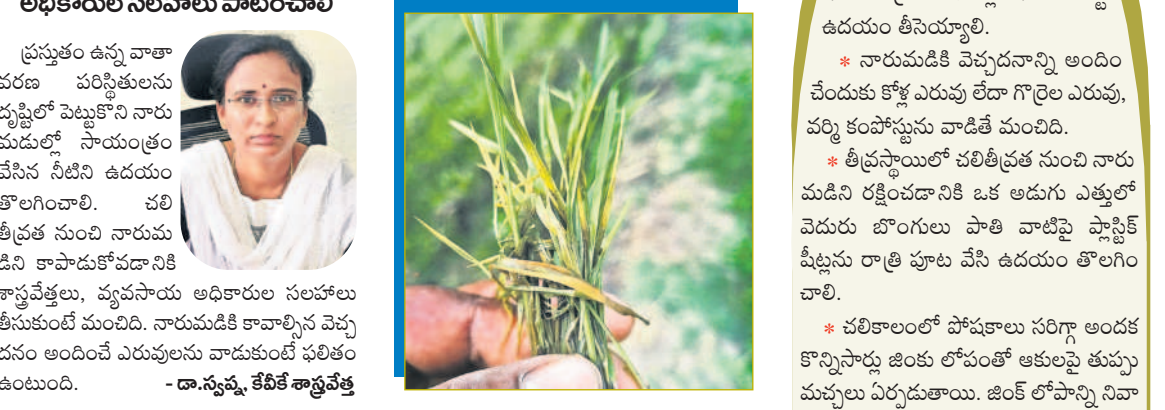
సూర్య నెట్వర్క్, డిసెంబర్ 7

ఉమ్మడి రంగారెడ్డి జిల్లాలో రైతులు ప్రధానంగా పండించే పంట వరి. వరి పండించడంలో రైతులకు పూర్తి అవగాహన ఉన్నప్పటికీ మితిమీరిన తెగులు సోకడంతో నష్టపోవాల్సిన పరిస్థితి వస్తున్నది. నారుమడి వేసిన నాటి నుంచి కోత కోసే వరకు మందులు పిచికారీ చేయాలి వస్తున్నది. ముందస్తుగానే రైతులు నారుమడి సాగులో తగు జాగ్రత్తలు తీసుకుంటే తెగుళ్ళ బారినుంచి తప్పించుకునే అవకాశం ఉన్నదని వ్యవసాయ శాస్త్రవేత్తలు సూచిస్తున్నారు.