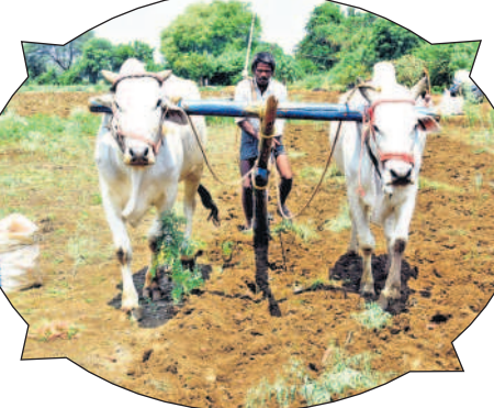
పంటల మార్పిడి విపరీతంగా పెరుగుతాయి.

పంట కోసిన వెంటనే వరి కొయ్యలను కాలొత్తుకుండా పొలంలోనే కలియదున్నాయి. దీంతో కొయ్యలు మట్టితో కప్పబడి కుళ్లే ప్రక్రియ ప్రారంభమవుతుంది. తర్వాత సేంద్రీయ ఎరువుగా మారుతుంది. వరి కొయ్యలను కలియదున్నడం, కచ్చు చేయడంతో నేలలో పురుగు రాకపోవడం, తేమ అవరి కావడం తగ్గి భూమి కోతకు గురికాకుండా ఉంటుంది. కొయ్యలను కలియదున్న వెంటనే కుళ్లిపోయేలా పొటా పియం చల్లితే సేంద్రీయ ఎరువుగా ఉపయోగపడుతుంది. తదుపరి పంటకు పోషకాలు విపరీతంగా పెరుగుతాయి.