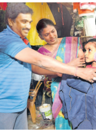
నల్లగొండ క్లాక్ టవర్ సెంటర్ వద్ద పిల్లలకు స్వేచ్ఛ కొంటన్న దృశ్యం

వాతావరణంలో పచ్చిన మార్పులతో గాలి, నీళ్లు, క్రిమికీటకాల ద్వారా రకరకాల వ్యాధులు వ్యాపిస్తాయి. చలికాలంతోపాటు సీజనల్ వ్యాధులు ప్రబలుతుంటాయి. కాలవ్యూం, సూర్యరశ్మి తక్కువగా ఉండటం వల్ల గాలి ద్వారా, వర్షపు నీటి ద్వారా వచ్చే డోమల కారణంగా క్రిమికీటకాల నుంచి రోగాలు వ్యాపిస్తాయి. ముఖ్యంగా వృద్ధులు, చిన్న పిల్లల్లో ఆరోగ్య సమస్యలు తలెత్తే అవకాశం ఉంటుంది. పగలు అధికంగా, రాత్రి తక్కువ ఉష్ణోగ్రతలు నమోదవుతుండటంతో వ్యాధులు సోకుతున్నాయి. దగ్గు, జలుబు, ఆస్తమా, చర్మ సంబంధ వ్యాధులు, న్యూమోనియా లాంటి జబ్బులు ఉక్కిరిబిక్కిరి చేస్తాయి. ఈ కాలంలో ఇన్ ఫ్లూయెంజా, ప్లూ వైరస్ లు దాడి చేసే ప్రమాదముంది. ఈ వైరస్ లతో జబ్బులు మట్టుముడుతాయని వైద్యులు హెచ్చరిస్తున్నారు. శరీరంలో తేమ శాతం తగ్గిపోవడంతో చర్మం ద్రవ్య శక్తి సన్నగిల్లుతుంది. వాతావరణ కాలవ్యూం, బహిరంగ దూమపానం వల్ల గొంతు సంబంధిత వ్యాధులు పెరుగుతాయని వైద్యులు చెబుతున్నారు.