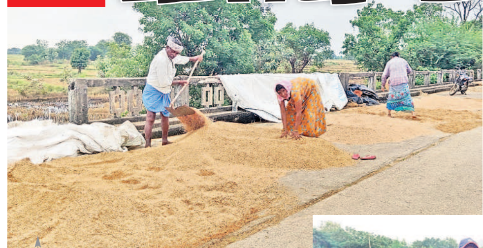
బయ్యారం: తడిసిన వరి ధాన్యాన్ని ఆరబెడుతున్న రైతులు శాయంపేట: ఆరపల్లిలో నీటిలో తేలుతున్న వరి పంట