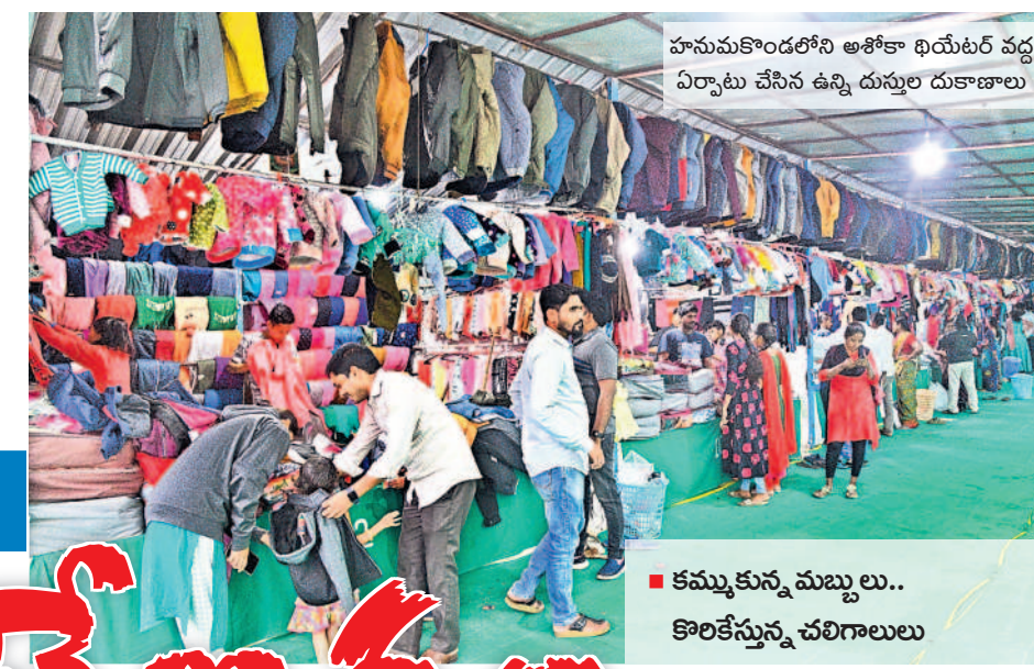
హనుమకొండలోని అశోకా థియేటర్ వద్ద ఏర్పాటు చేసిన ఉన్ని దుస్తుల దుకాణాలు