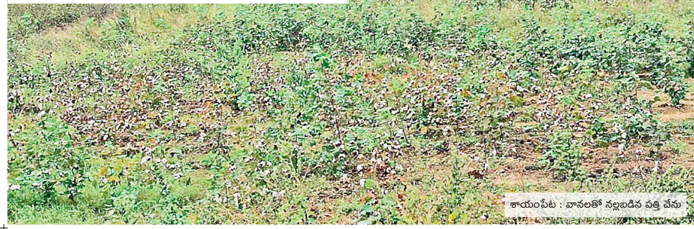
శాయంపేట: వానలతో నల్లబారిన పత్తి చేను