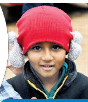
మిగజాం తుఫాన్ ఎఫెక్ట్