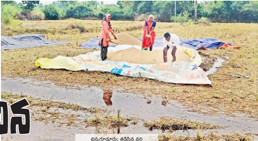
చిన్నగూడూరు: తడిసిన వరి ధాన్యాన్ని చూపుతున్న రైతు కుటుంబం