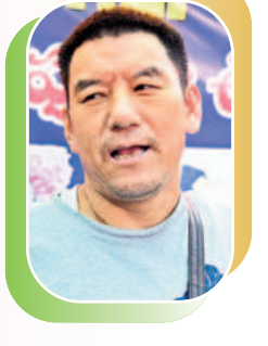
కర్క, వ్యాపార, టిబెట్

నా చిన్నప్పటి నుంచి ప్రతి సంవత్సరం చలికాలం లీబెట్ నుంచి ఇక్కడి వస్తున్నాం. హనుమకొండ పాత మున్సిపల్ మైదానంలో స్వెటర్లు, జర్కీస్లు, శాలువలు, గౌజులు, టోపీలు, మాస్కులు అమ్ముతున్నాం. వ్యాపారం అనుకున్న స్థాయిలో ఉండడం లేదు. తుఫాన్ తో చలి తీవ్రత ఎక్కువగా ఉంది. ఇప్పుడు గిరాకీ పెరిగింది. గతం కంటే ఇప్పుడు ఫర్మాలో.. కర్క, వ్యాపార, టిబెట్ నగరంలోని వివిధ ప్రాంతాల్లో టిబెట్ దేశ