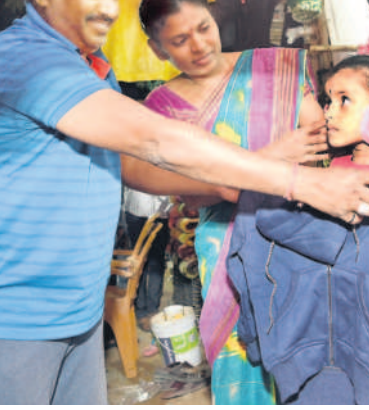
నల్లగొండ క్లాక్ టవర్ సెంటర్ వద్ద పిల్లలకు స్నెట్టర్లు కొంటున్న దృశ్యం