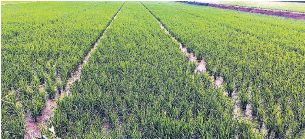
నేరేడువర్ర మండలం బిల్లేపల్లిలో నాలు వేసిన వరి(ఫైల్)