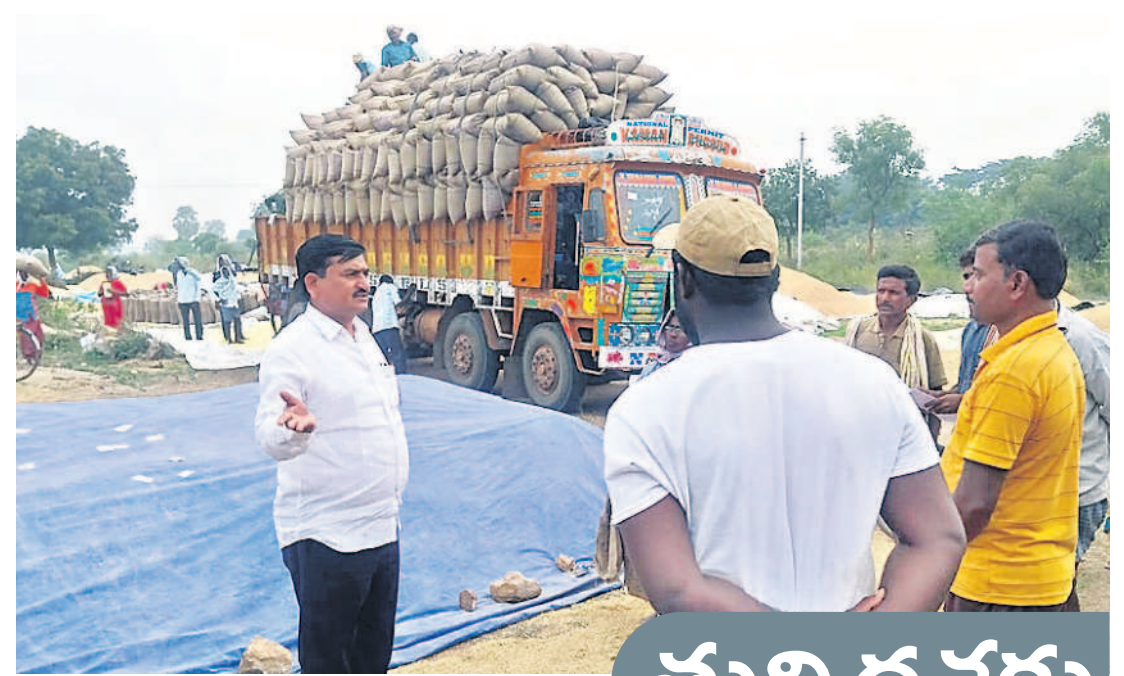
సూర్యాపేట మండలం బాలెంలలో ధాన్యం కొనుగోళ్లు

సీజనల్ వ్యాధులు ప్రబల అవకాశం ఉండటంతో జాగ్రత్తలు పాటించాలని వైద్యులు సూచిస్తున్నారు. ఆస్తమా ఉన్న వారు నిత్యం వాడే మందులను అందుబాటులో ఉంచుకోవాలి. దుమ్ము, ధూళి పనులకు దూరంగా ఉండాలి. చర్మని గాలికి ఎక్కువగా తిరగొద్దు. ప్రయాణం చేస్తున్నప్పుడు నోరు, ముక్కు కవచ ఆయిల్ లా మాస్కులు, స్నెట్టర్లు ధరించాలి. బైక్ పై వెళ్లేవారు మోటార్ తప్పనిసరిగా ధరించాలి. హాట్ వేపింట్లు, గుండె ఆపరేషన్ చేయించుకున్న వారు తగిన జాగ్రత్తలు తీసుకోవాలి. చలిలో ఎక్కువగా తిరగడం వల్ల రక్తనాళాలు సంకోచించి గుండె సమస్యలు వచ్చే అవకాశం ఉంది. జ్వరం, దగ్గు, జలుబు వస్తే ఇంట్లోనే ఉండాలి. బయట ఎక్కువగా తిరగవద్దు. ప్రతి రోజూ వ్యాయామం చేయాలి. నూలు వస్తాయి ధరించాలి. చిన్నపిల్లల చేతులు, కాళ్ళకు గ్లోజ్ లు వేయాలి. కాళ్ళు, చేతులు పగుళ్లు రాకుండా వ్యాజిలిన్ రాసుకోవాలి. ఉదయం 8 గంటల కంటే ముందు, సాయంత్రం 6 గంటల తర్వాత దూర ప్రయాణాలను రద్దు చేసుకుంటే మంచిది. బీబీ, షుగర్ ఉన్న వారు సైతం జాగ్రత్తలు పాటించాలి.