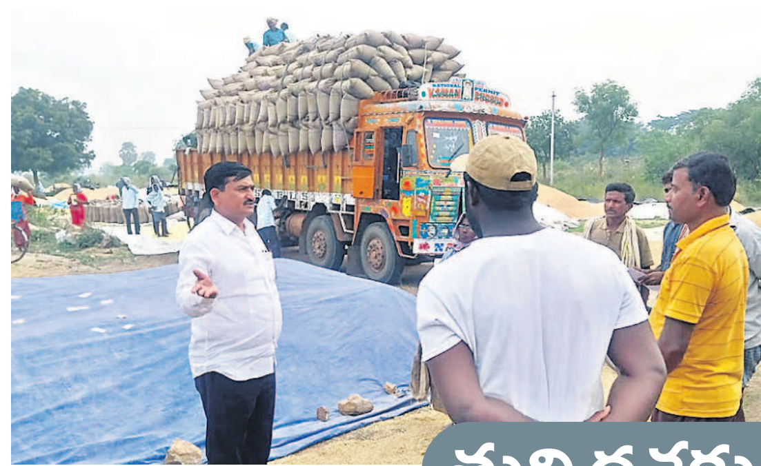
సూర్యాపేట మండలం బాలెంలలో ధాన్యం కొనుగోళ్లు