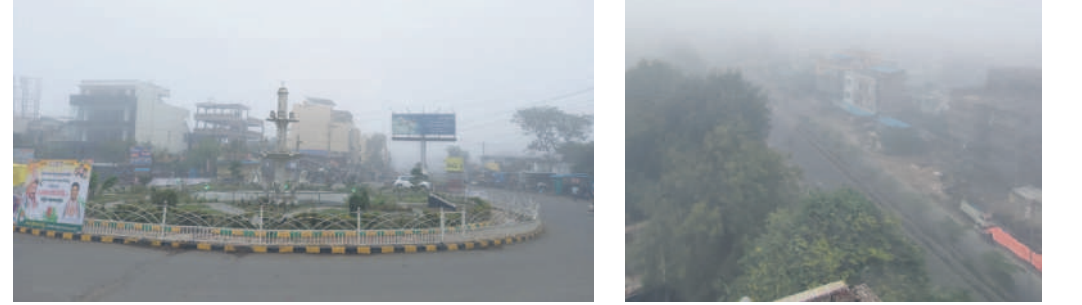
ఆదిలాబాద్ ఎన్టీఆర్ చౌకలో మంచు తెర