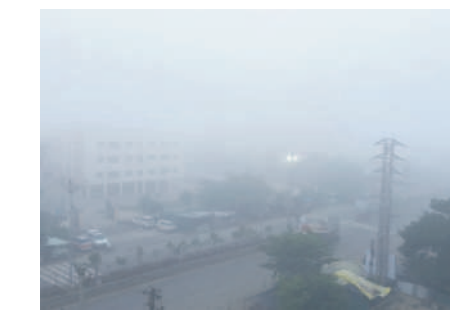
ఆదిలాబాద్ కలెక్టర్ చౌకలో మంచు దుప్పటి