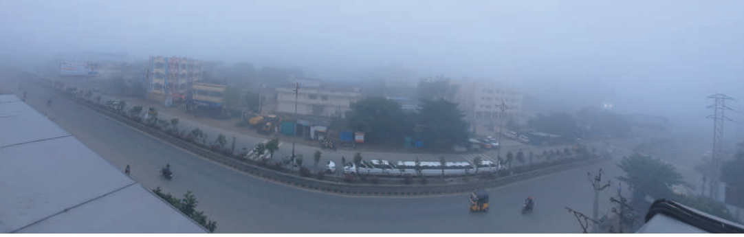
ఆదిలాబాద్ పట్టణంలో కమ్మకున్న మంచు