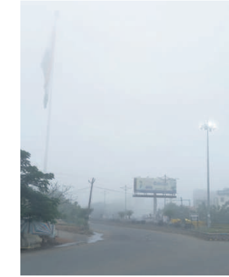
ఆదిలాబాద్ ఎన్టీఆర్ చౌకలో మంచు తెర