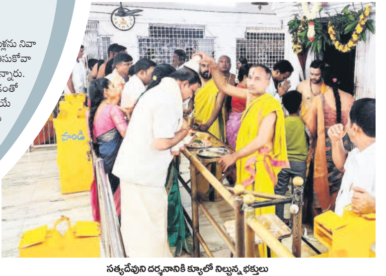
సత్యదేవుని దర్శనానికి క్యూలో నిల్చున్న భక్తులు