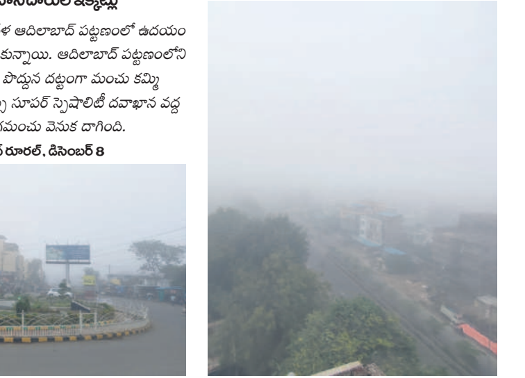
ఆదిలాబాద్ జిల్లాకేంద్రంపై కమ్మకున్న పొగమంచు