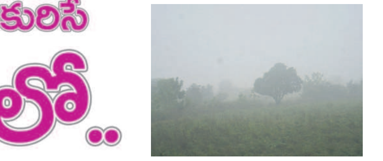
గుడిపాతూర్ మండలం సీకాగిరి వద్ద పాలంబై