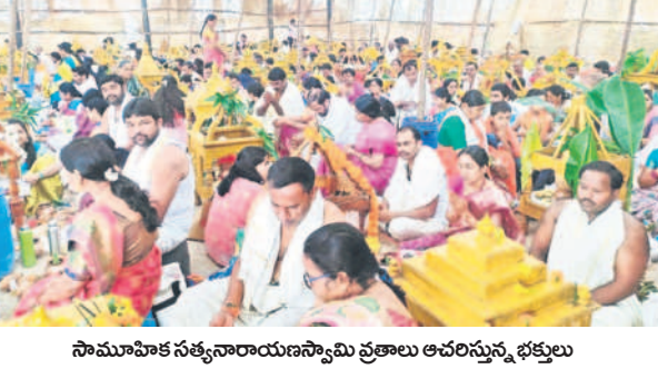
సామూహిక సత్యనారాయణస్వామి వ్రతాలు ఆచరిస్తున్న భక్తులు