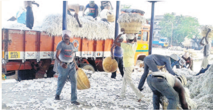
సీసీఐ కేంద్రానికి రైతులు తీసుకువచ్చిన పత్తిపంట (ఫైల్)

ఖమ్మం వ్యవసాయం, డిసెంబర్ 8: భారత పత్తి సంస్థ (సీసీఐ) ఖమ్మం జిల్లా వ్యాప్తంగా ఇప్పటి వరకు 12,590 క్వింటాళ్ల పత్తిపంటను కొనుగోలు చేసింది. కలెక్టర్ వీపీ గౌతమ్ ఆదేశాల మేరకు కొద్ది రోజుల క్రితమే జిల్లా మార్కెటింగ్ శాఖ జిల్లాలో 10 సీసీఐ కేంద్రాలను ఏర్పాటు చేసింది. ఖమ్మం వ్యవసాయ మార్కెట్ పరిధిలో మూడు, మధిర ఏఎంసీ పరిధిలో మూడు, మద్దలపల్లి ఏఎంసీ పరిధిలో రెండు, నేలకొండపల్లి, వైరా ఏఎంసీ పరిధిలో ఒక్కొక్కటి చొప్పున కొనుగోలు కేంద్రాలను ఏర్పాటు చేశారు. వీటిలో జిఆర్ఆర్ జిస్సింగ్ మిల్ సెంటర్లో 1,469 క్వింటాళ్లు, అమరావతి టెక్స్టైల్స్ జిస్సింగ్ మిల్లో 2,162