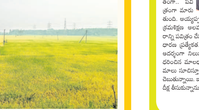
కొత్తలకు వచ్చిన వరి పొలాలు

జిల్లా వ్యాప్తంగా ఇప్పటికే 120 కొనుగోలు కేంద్రాలను ప్రారంభించాం. ఈ ఏడాది 2 లక్షల మెట్రిక్ టన్నుల ధాన్యాన్ని కొనుగోలు చేయాలని లక్ష్యంగా నిర్దేశించు కున్నాం. రైతులకు అవసరమైన గన్నీ బ్యాగులను, తేమ శాతం నిర్ధారణ యంత్రాలను ఆయా కేంద్రాల్లో అందుబాటులో ఉంచాం. ధాన్యం ఆరబోసుకోవడానికి డ్రైడ్రీ శాలు కూడా ఉన్నాయి. కొనుగోలు కేంద్రాల వద్ద ఆరబోసుకోవడానికి టార్మింగ్ మెషిన్లు ఉంచాం. ధాన్యాన్ని విక్రయించే రైతులు తమ బ్యాగులకు ఆకౌంట్ పాస్బుక్స్, అధార్ కార్డులను తీసుకురావాలి. -శ్రీనాథబాబు, డిఎం, సివిల్ సప్లయ్స్, భద్రాద్రి జిల్లా