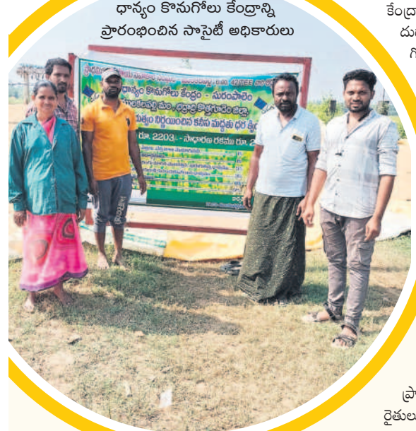
ధాన్యం కొనుగోలు కేంద్రాన్ని ప్రారంభించిన సానైటీ అధికారులు

క్వింటాళ్లు, మంజీల్ కాటన్ మిల్ సెంటర్లో 1,981 క్వింటాళ్లు, శ్రీశివ కాటన్ మిల్లో 887 క్వింటాళ్లు, ఉషశ్రీ కాటన్ మిల్లో 2,295 క్వింటాళ్లు, ఎంఎన్ షట్టర్స్ జిన్సింగ్ మిల్లో 793 క్వింటాళ్లు, అలాగే, జీఆర్ఆర్ జిన్సింగ్ మిల్ల ద్వారా 2,604 క్వింటాళ్లు, శ్రీభాగ్యలక్ష్మి కాటన్ మిల్ల ద్వారా 1,056 క్వింటాళ్లను సీసీఐ బయ్యట్ల కొనుగోలు చేశారు. మొత్తం పది కేంద్రాలను ఏర్పాటు చేయగా వాటిలో రెండు సీసీఐ కేంద్రాల్లో శుభ్ర వారం నాటికి క్రయవిక్రయాలు ప్రారంభం కాలేదు. మిగిలిన 8 కేంద్రాల్లో మాత్రమే సీసీఐ ఖరీదుదారులు పంటను కొనుగోలు చేస్తున్నారు. ఏటా ప్రారంభం నుంచి చివరి వరకు సీసీఐ సుమారుగా