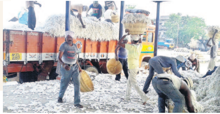
సీసీఐ కేంద్రానికి రైతులు తీసుకువచ్చిన పత్తిపంట (ఫైల్)

ఖమ్మం వ్యవసాయం, డిసెంబర్ 8: భారత పత్తి సంస్థ (సీసీఐ) ఖమ్మం జిల్లా వ్యాప్తంగా ఇప్పటి వరకు 12,590 క్వింటాళ్ల పత్తిపంటను కొనుగోలు చేసింది. కలెక్టర్ వీపీ గౌతమ్ ఆదేశాల మేరకు కొద్ది రోజుల క్రితమే జిల్లా మార్కెటింగ్ శాఖ జిల్లాలో 10 సీసీఐ కేంద్రాలను ఏర్పాటు చేసింది. ఖమ్మం వ్యవసాయ మార్కెట్ పరిధిలో మూడు, మధిర ఏఎంసీ పరిధిలో మూడు, మధ్యపల్లి ఏఎంసీ పరిధిలో రెండు, నేలకొండపల్లి, వైరా ఏఎంసీ పరిధిలో ఒక్కొక్కటి చొప్పున కొనుగోలు కేంద్రాలను ఏర్పాటు చేశారు. వీటిలో జీఆర్ఆర్ జిన్సింగ్ మిల్ సెంటర్లో 1,469 క్వింటాళ్లు, అమరావతి టెక్స్టైల్స్ జిన్సింగ్ మిల్లో 2,162