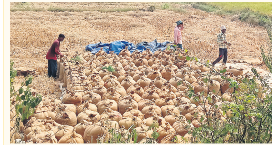
చాతకొండలో ధాన్యాన్ని బస్తాల్లో నింపుతున్న రైతులు