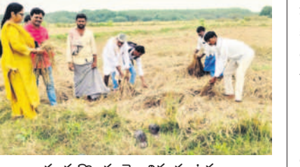
చండ్రుగొండ: దెబ్బతిన్న పంటను పరిశీలిస్తున్న ఏడీఏ

అన్నపురెడ్డిపల్లి, డిసెంబర్ 8: మండలంలోని రాజా పురం, అన్నపురెడ్డిపల్లి, పెంట్లం, మర్రిగూడెం గ్రామాల్లో