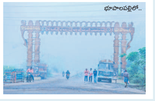
భూపాలపల్లిలో.. నర్సంపేట రూరల్ : ఇటుకాలపల్లి ప్రధాన రహదారిపై..