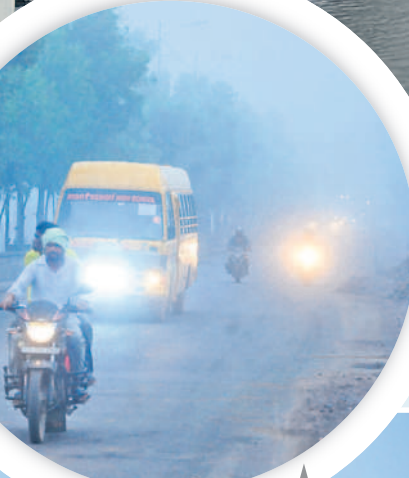
భూపాలపల్లిలో ప్రధాన రహదారిపై లైట్లు వెలుతురు ప్రయాణిస్తున్న వాహనదారులు