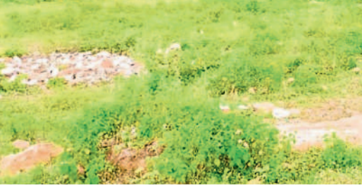
గట్టమ్మ వద్ద ఉన్న గిరిజన యూనివర్సిటీ భూములు (ఫైల్)