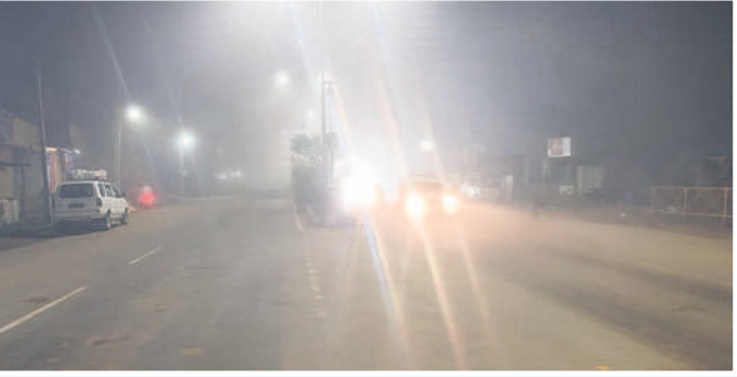
గోవిందరావుపేటలో ప్రధాన రహదారిపై..