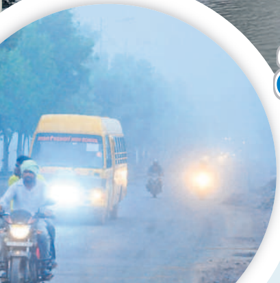
భూపాలపల్లిలో ప్రధాన రహదారిపై లైట్లు వెలుతురు ప్రయాణిస్తున్న వాహనదారులు