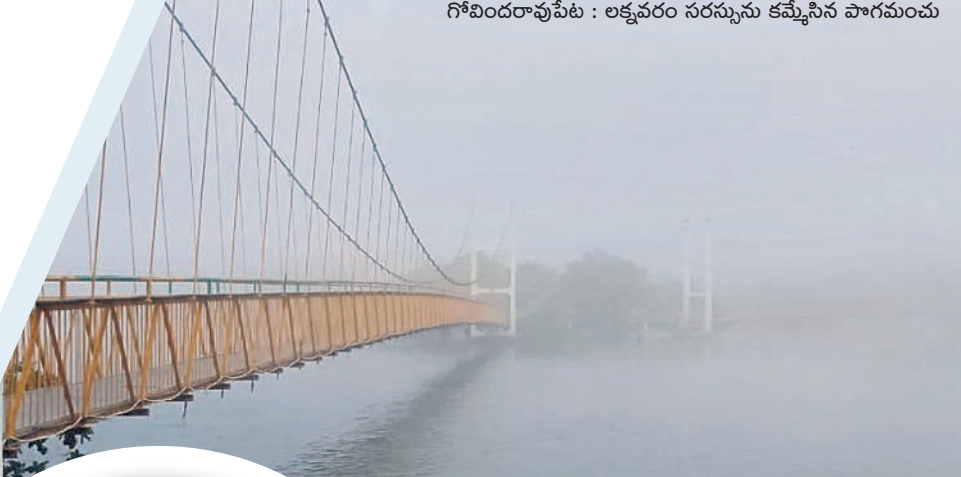
గోవిందరావుపేట : లక్షవరం సరస్సును కమ్మేసిన పొగమంచు