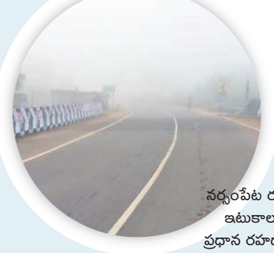
నర్సంపేట రూరల్ : ఇటుకాలపల్లి ప్రధాన రహదారిపై..