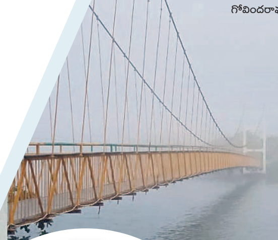
గోవిందరావుపేట : లక్షవరం సరస్సును కమ్మేసిన పొగమంచు