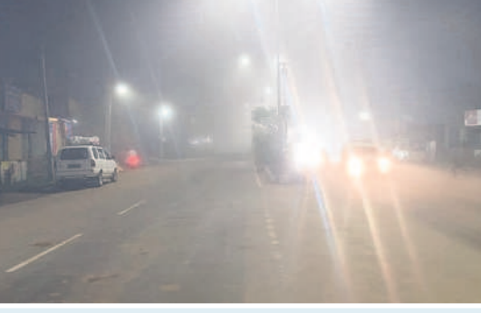
గోవిందరావుపేటలో ప్రధాన రహదారిపై..