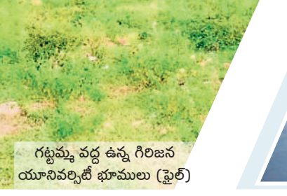
గట్టమ్మ వద్ద ఉన్న గిరిజన యూనివర్సిటీ భూములు (ఫైల్)

జీఆర్ఎస్ కృషి వల్లే.. ఎంపీ మాలిక్ కవిత మానుకోవాలి పార్లమెంటులో పరిధిలోని ములుగు జిల్లాలో గిరిజన యూనివర్సిటీ ఏర్పాటుకు రోక సభ ఆమోదం లభించడం సంతోషంగా ఉంది. యూనివర్సిటీలో ఈ ప్రాంత గిరిజన విద్యార్థులకు ఎంతో ప్రజయోజనం కలుగుతుంది. గతంలో కేసీఆర్ నాయకత్వంలో కేంద్రానికి బీఆర్ఎస్ ఎంపీలు అనేక మార్లు విన్నవించడం వల్లే ఇప్పుడు కల సాకారమవుతున్నది. యూనివర్సిటీ ఏర్పాటు విషయం విభజన చట్టంలో స్పష్టంగా ఉన్నా ఈ ప్రాంతవాసులను కేంద్ర ప్రభుత్వం కాలయాపనతో ఇబ్బంది పెట్టింది. ఇప్పటికైనా ఈ ప్రాంత వాసుల కోరిక నెరవేరుతున్నందుకు ఆనందంగా ఉంది.