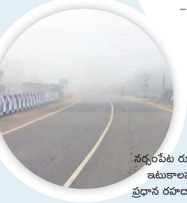
నర్సంపేట రూరల్ : ఇటుకాలపల్లి ప్రధాన రహదారిపై..