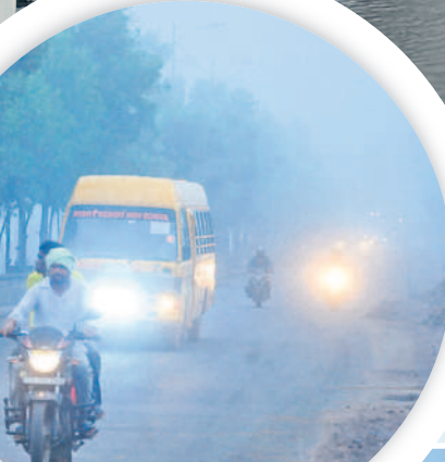
భూపాలపల్లిలో ప్రధాన రహదారిపై లైట్లు వెలుతురు ప్రయాణిస్తున్న వాహనదారులు