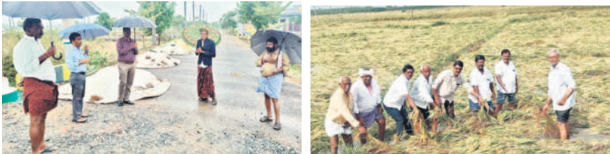
కూసుమంచి: తడిసిన ధాన్యాన్ని పరిశీలిస్తున్న ఏడీఏ విజయచంద్ర, మధిర: పంటను పరిశీలిస్తున్న రైతు నాయకులు

కూసుమంచి, డిసెంబర్ 8: పాలేరు నియోజకవర్గంలోని నాలుగు మండలాల్లో 1,720 ఎకరాల్లో వరి, మిర్చి, మక్క పంటలు దెబ్బతిన్నట్లు ప్రాథమిక అంచనా వేశామని ఏడీఏ విజయ చంద్ర తెలిపారు. నాలుగు మండలల్లోని వ్యవసాయ శాఖ అధికారులు ఇప్పటికే క్షేత్ర స్థాయిలో పలు గ్రామాల్లో పర్యటించినట్లు తెలిపారు. నియోజకవర్గంలో 61 ప్రాంతాల్లో పంటలకు నష్టం వాటిల్లిందని తెలిపారు. 1,610 మంది రైతులకు చెందిన 1,168 ఎకరాల్లో వరి, 95 మంది రైతులకు చెందిన 80 ఎకరాల్లో మిర్చి తోటలు, 15 మంది రైతులకు చెందిన 10 ఎకరాల్లో మక్క పంట దెబ్బతిన్నట్లు తెలిపారు. ప్రాథమిక అంచనాలు పంపామని పేర్కొన్నారు.