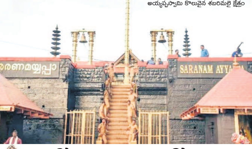
అయ్యప్పస్వామి కొలువైన శబరిమలై క్షేత్రం