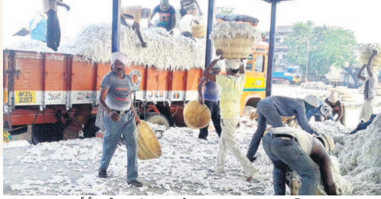
సీసీఐ కేంద్రానికి రైతులు తీసుకువచ్చిన పత్తిపంట (ఫైల్)

ఖమ్మం వ్యవసాయం, డిసెంబర్ 8: భారత పత్తి సంస్థ (సీసీఐ) ఖమ్మం జిల్లా వ్యాప్తంగా ఇప్పటి వరకు 12,590 క్వింటాళ్ల పత్తిపంటను కొనుగోలు చేసింది. కలెక్టర్ వీపీ గౌతమ్ ఆదేశాల మేరకు కొద్ది రోజుల క్రితమే జిల్లా మార్కెటింగ్ శాఖ జిల్లాలో 10 సీసీఐ కేంద్రాలను ఏర్పాటు చేసింది. ఖమ్మం వ్యవసాయ మార్కెట్ పరిధిలో మూడు, మదీర ఏఎంసీ పరిధిలో మూడు, మద్దలపల్లి ఏఎంసీ పరిధిలో రెండు, నేలకొండపల్లి, వైరా ఏఎంసీ పరిధిలో ఒక్కొక్కటి చొప్పున కొనుగోలు కేంద్రాలను ఏర్పాటు చేశారు. వీటిలో జిఆర్ఆర్ జిస్సింగ్ మిల్ సెంటర్లో 1,469 క్వింటాళ్లు, అమరావతి టెక్స్టైల్స్ జిస్సింగ్ మిల్లో 2,162